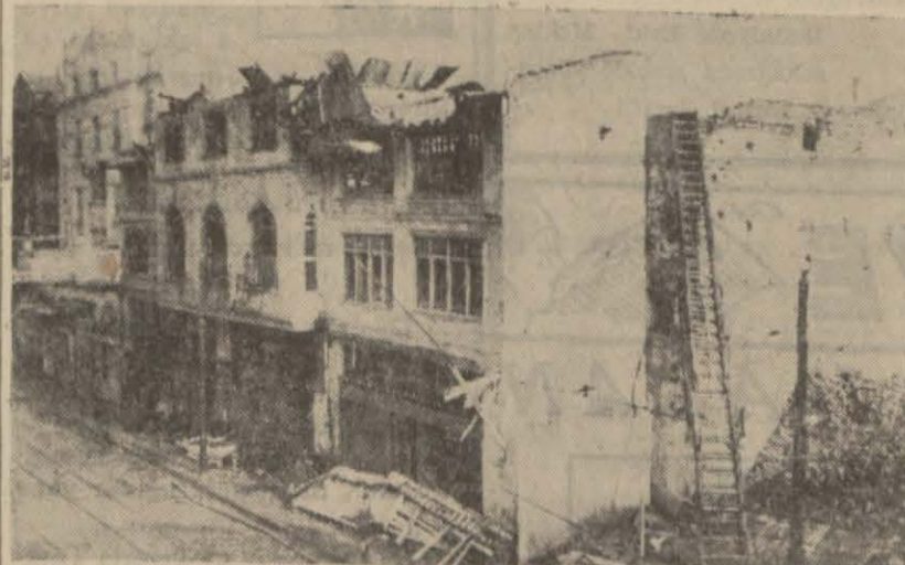
Gece Londra, Alman hücumlarından sonra çıkan yangınlardan, böyle gözüküyordu...

İngiltere çok garip bir memleketdir. Harp, mü-nakasa hürriyetini askeri meselelerde bile kesmemiştir. Mihver âlemi, bu hürriyetin tadını kaybettiği için İngilteredeki münakaşaları bir zaaf ve aciz âmeti sayar. Mal bulmuş makribi gibi bu münakaşaların üzerine çulllanır. Halbuki akıllara hayret veren İngiliz mukavemetinin asil kaynağı, bu münakaşa hürriyetidir. Bu sayede halk propaganda telkinleri ile iradesiz ve uyusuk bir hale düşmekten kurtulur. Dipdiri bir şahsi kanaate sahip kalır. Bilecek inanarak sarfedilen emek ve fedakârlığın, yumruk altında yapılan fedakârlıktan çok verimli olduğunu bütün delillerle görüyoruz.