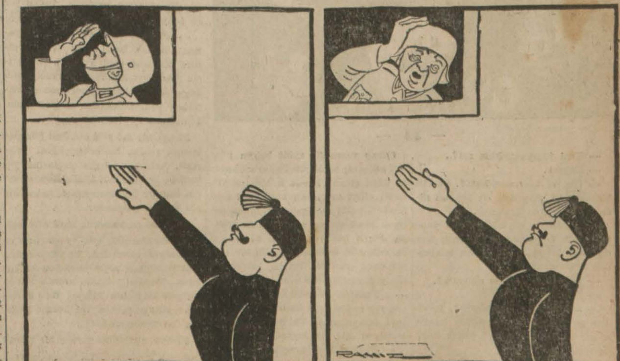
Selâm verdi Borçlu çıktı

B. Filof açıkça bildirmiştir ki, Bulgar milleti haklı şikâyetlerini mihver devletlerinin kendi menfaatleri uğrunda kullanmalarına asla müsaade etmeyecektir. Balkanlarda ve Türkiye'de büyük bir memnuniyet uyandıran ve Bulgar istiklâli için iyi bir alâmeti teşkil eden B. Filof'un beyanatu muannit Bulgar milletinin Roman (Devamı Sa: 5, Sü: 4 de) **