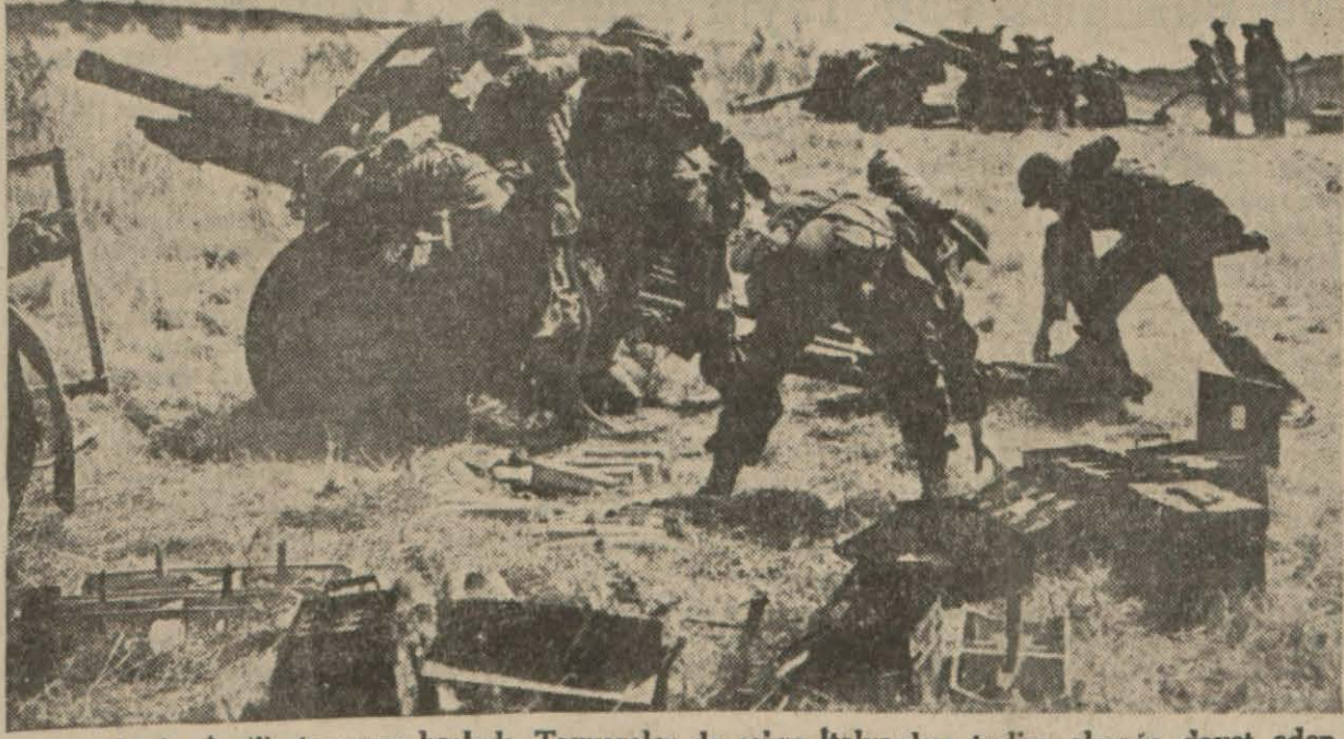
Tobruka İngiliz taarruzu başladı. Taryareler de şehre İtalyanları teslim olmağa davet eden beyannameler atmaktadırlar. Bardiya garnizonu şiddetli topçu ateşinden ve yapılan tazyikten sonra beyannameler üzerine teslim olmuştu. Tobrukta da aynı şey yapılmaktadır. Resmimiz Afrikadaki İngiliz topçularını faaliyet halinde göstermektedir.