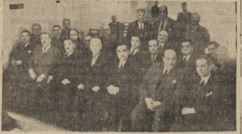
Eczacılar Birliğinin dünkü kongresinde

Kızılay Vasıtasıyla İlaç ve Kimyevi Maddeler Getirilmesi Görüşüldü