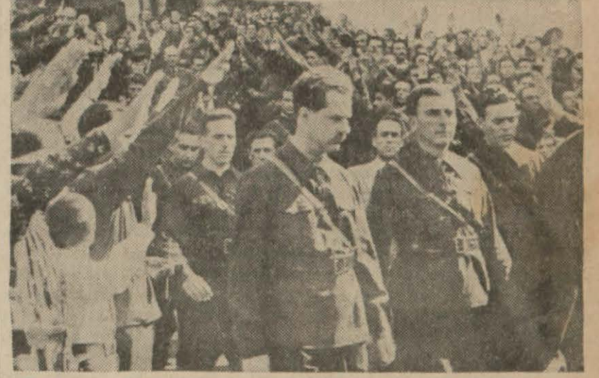
Romanya Demirmuhafızları ve şefleri, ölümlerinin hatıralarını yadediyorlar