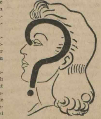
Kaybolan sefaret kâtibinin çekindiği meğul kadın kim? (Devamı Sa: 5, Sü: 2 de) *

Lehistan işgale uğrayınca bu canlı zabıta romanının kahramanı, Leh mültecileri arasında karışıyor. Fakat Lehlik sıfatını uzun müddet muhafaza etmiyor, 3 Eylül 1939 tarihinde Şili tabiiyetine geçiyor. Şili hükümeti Leh tebaasının himayesi vazifesini üzerine aldığı için Mikicinski için çok geniş bir faaliyet sahası keşfediyor. Şili hükümetinin aynı zaman-