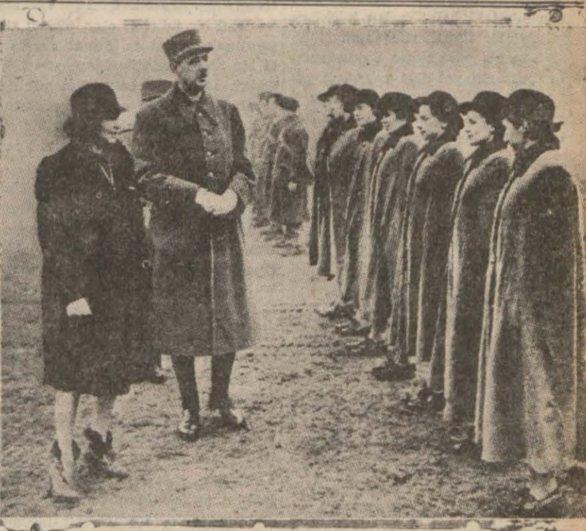
Fransanın taarruzuna uğrayacağı söylenen Hür Fransız imparatorluğu şefi General de Gaul Afri'ye kadı hizmet gören habstabakıcıları teftiş ediyor

de vazife gören ufak tefek Fransız gemilerine kumanda etmektedir. Bu itibarla Amiral Darlan tam tânaasile bir tatlı su amiralidir. Ren bavalisindeki vazifesile alakası olan ufak tefek işleri uğraşırken, Kilikyada ne olmuş, İngilizler ne yapmış, Fransızlar ne etmiş, Türk istiklâl mücadelesi için ne yapıldığı zaman Ren üzerine