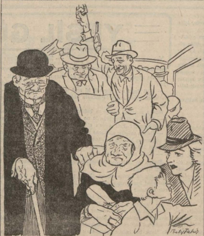
— Koskoca Fransa nasıl çöktü diye dünya kadar merak ediyor, bir türlü akıl erdiremiyordum... — Artık akıl erdirdin mi? — Elbette!.. Amiral Darlan gibiler yüzünden çöktüğü bebelli!

«Bağdattan, Londra yoluyla gelen bir telgrafa, dün Bağdada giren kral naibi Abdül İlah, şehrin ileri gelenleri (Devamı Sa. 5, Sü. 1 de) —