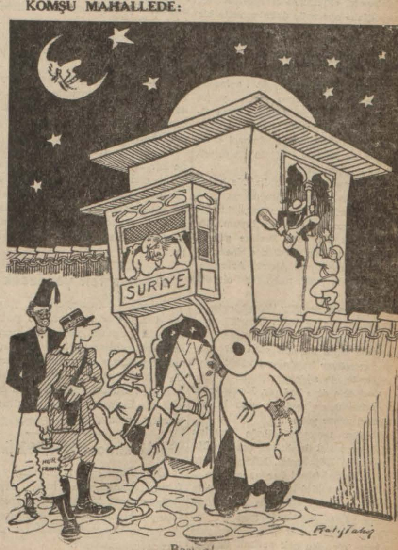
Başk... (Devamı: Sa. 5, S. 5 te) //

Şehrimizin iki meşur ticaret müessesesi, ihtikâr yapığundan dolayı Adliyeye verilmiştir. Bunlardan biri, Beyoğlunda bulunan Haylayf, diğeri, Karlıman mağazasıdır. Karlman pasajı sa-