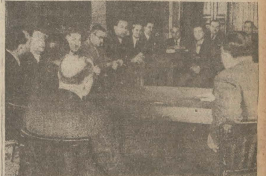
Valinin riyasetinde dün yapılan sayım toplantısı. Dün sayım bürosunda vali ve belediye reisi Doktor Lütfi Kırdar başkanlığı altında bir toplantı yapılmıştır. Vali muavinleri, kaymakamlar ve sayım bürosu azalarının iştirak ettikleri bu toplantıda vali Lütfi Kırdar sayım günü yapılacak işler hakkında lazım gelen emirleri verdikten sonra sayıma müteallik ihtiyacıların vilâyette tamamen karşılandığını ve sayım işinde vukua gelecek herhangi noksandan mütevellit mesuliyet için hiçbir mazaretin kabul edilemeyeceğini bildirmiştir. (Devam: Sa. 4, Sü. 1)

Hastası Olanların Doktor ve Ebe İçin Memurlara Haber Vermeleri Kâfidir