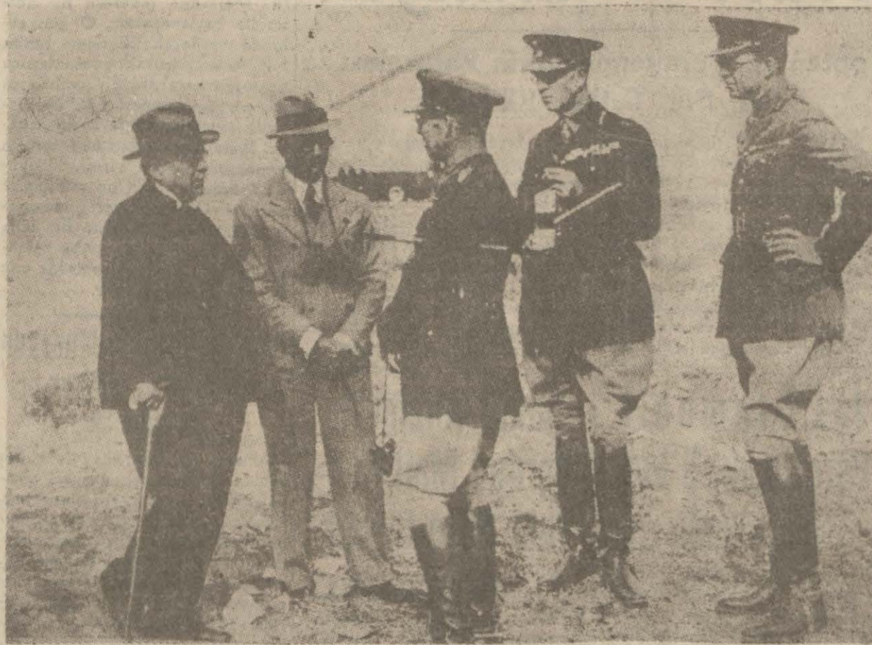
Kapıları mihver tarafından yoklanan Yunanistan'dan bir intiba: Son Yunan manevralarında Yunan Kralı, Yunan veliahdı, General Metakasa hep bir arada

Hele ilk hamlede en küçük bir (Devam: Sa. 4 Sü. 4 te)