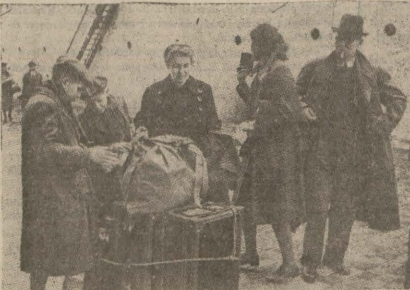
Dün Romanyadan gelen yolculardan bir grup

Yolcular Arasında Kor Diplomatige Mensup Zevatla Teknisyenler de Var