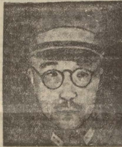
Japon Başvekil General Tojo