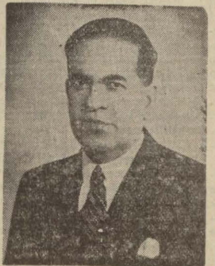
Vali Lütfi Kırdar

VALİ ve belediye reisi Lütfi Kırdar belediyenin yeni çalışma durumu etrafında gazetecilere izahat vermiştir. Ticaret vekâletinin kararile