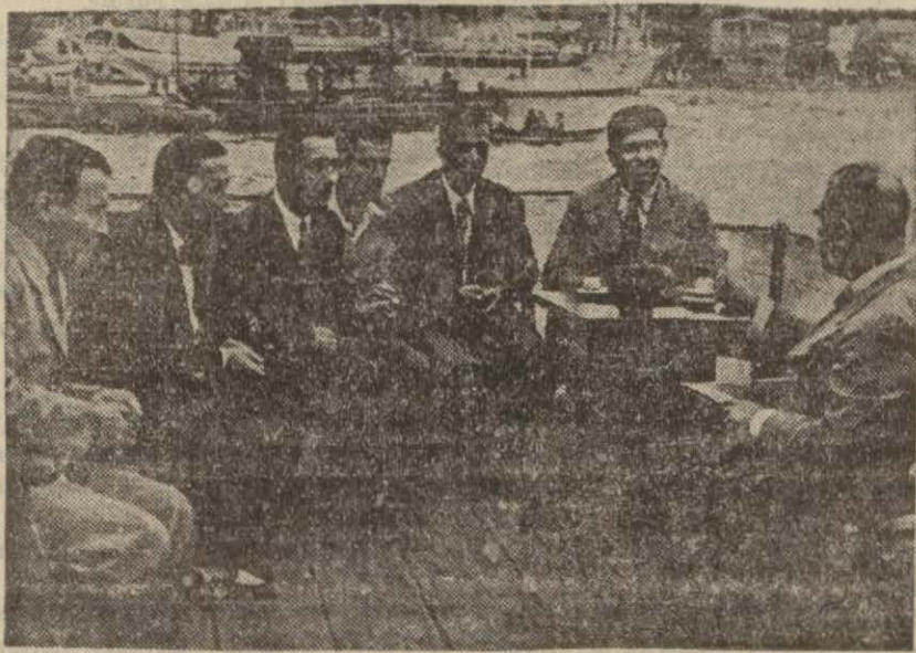
Maarif Vekili Bebekte Galata saray denizcilik şubesinde. . .

Şehrimizde bulunan Maarif Vekili Hasan Ali Yücel tetkiklerine devam etmektedir. Öğleden sonra maarif müdürlüğüne gelerek umumî müfettişlerle bir görüşme yapmıştır. Bu görüşmede okul, öğretmen ve diğer maarif işleri etrafında kendilerinden malûmat al