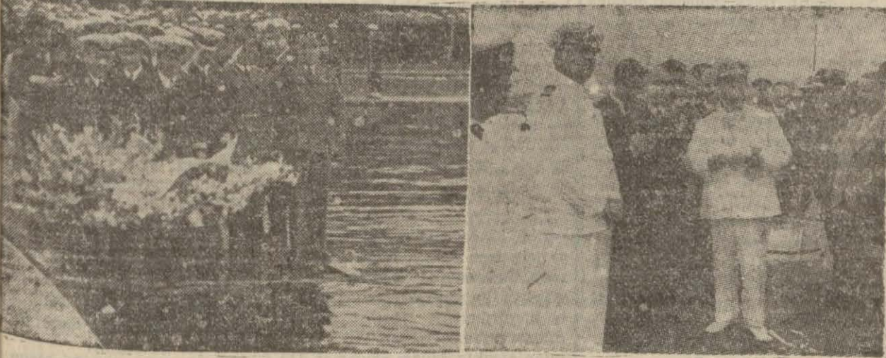
Şehitlerimiz için yapılan bir törence denize çelenk atılıyor. Amiral Şükür Okan nutuk söylerken