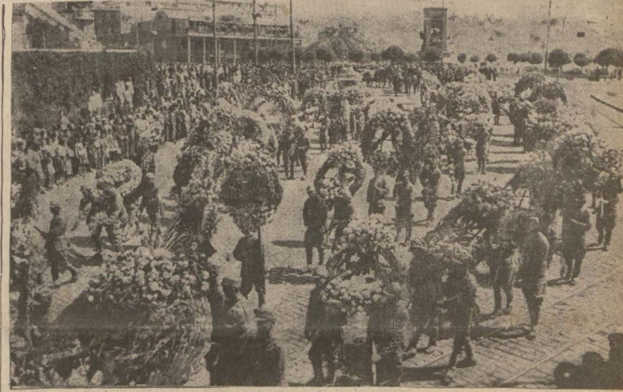
Cenaze alayı Taksimden geçerken...

Reisicumhur İSMET İNÖNÜ (Devamı Sa. 2. Sü. 5. de)