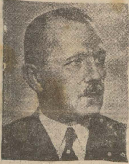
Başvekil Şükrü Saracoğlu

Şükrü Saracoğlu, hariciye Vekâletini de uhdesine aldı