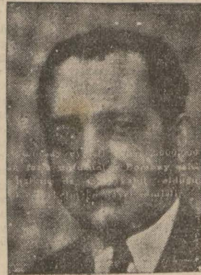
Ziraat Vekili Şevket Raşit Hatipoğlu