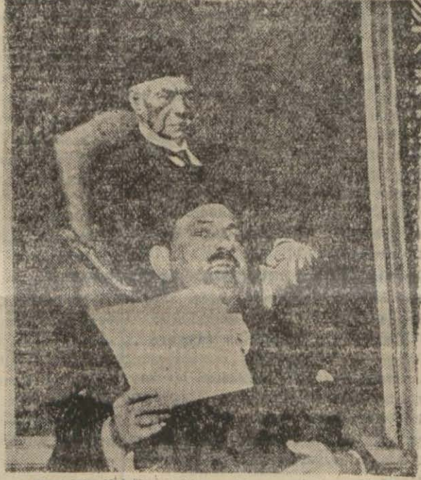
Vaft Partisi Reisi Nahas Paşa nutuk söylüyor (Arkasında partinin müessisi Said Zağlul Paşanın bir tablosu görülmektedir)

Vaşington, 6 (A.A.)—Matbuat toplantısında beyanatta bulunan (Devamı Sa. 2 Sü. 4 de)