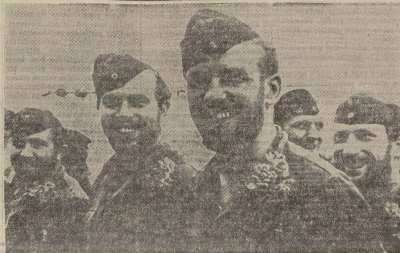
Uzak denizlerde haftalarca denizaltî iclerinde kaldıktan sonra Almanya'ya dönen denizaltî askerleri

Alman denizaltıları 367000 tonlütuluk 56 gemi batırdı