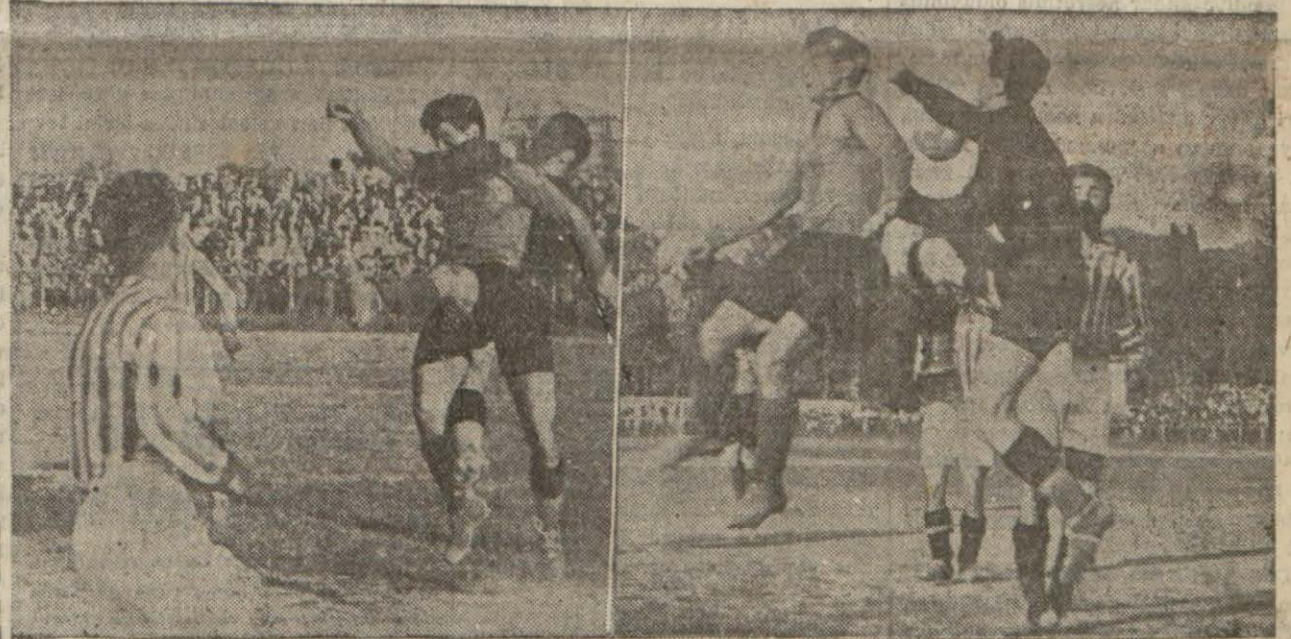
Dünkü İstanbul muhtelti — Rapid maçından iki enstantane