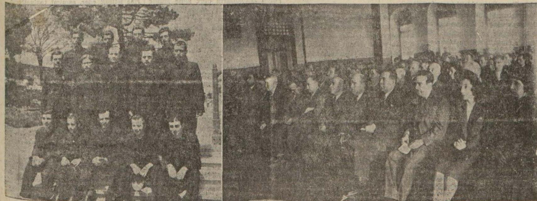
Darüşşafakanın yıldönümü merasimine iştirak edenler ve bu sene mezunları bir arada