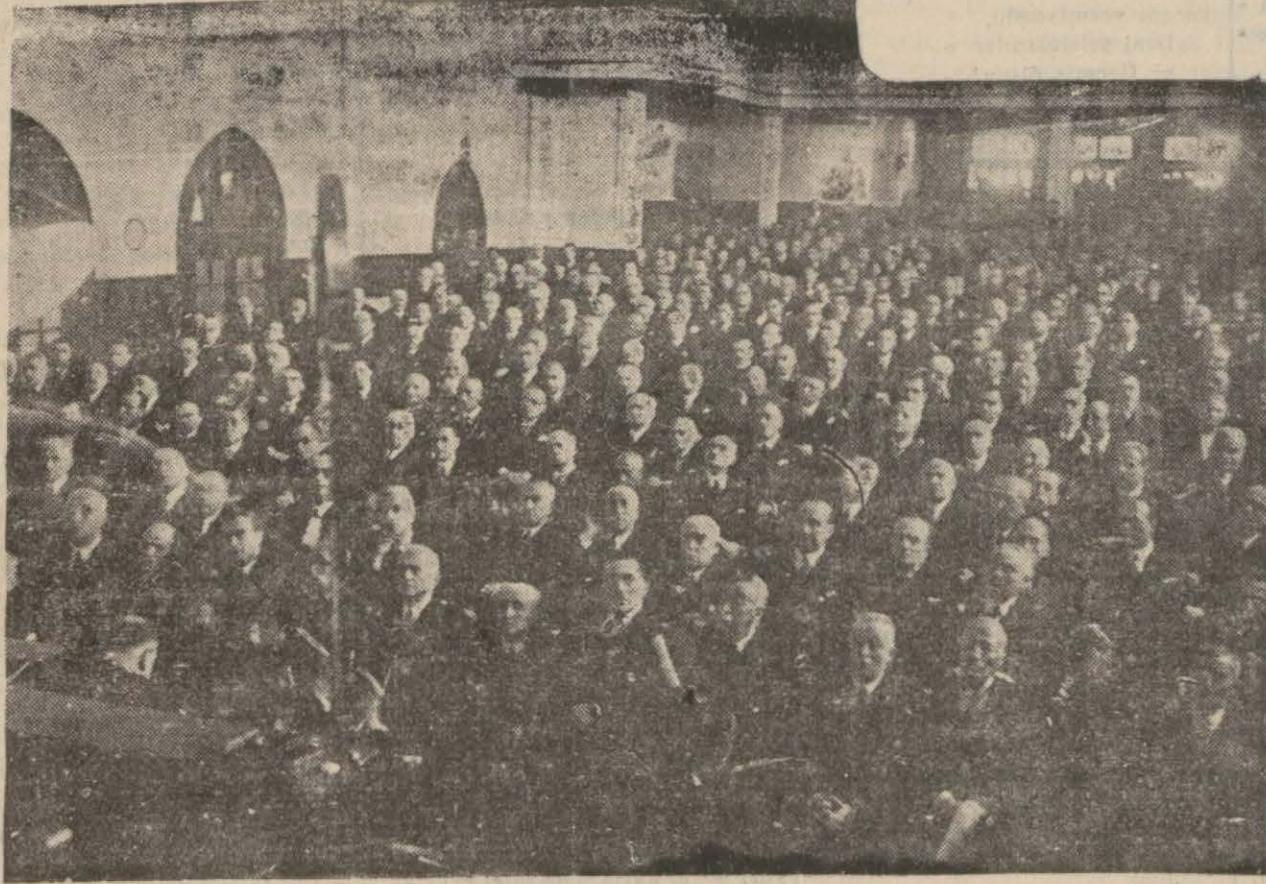
Büyük Millet Meclisinin tarihi celsesinden bir görüntü...