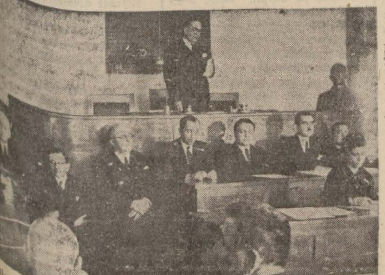
Şehir meclisinin dünki celsesinde vali ve belediye reisi nutuk söylerken... (Yazısı 2 nci sayfa)