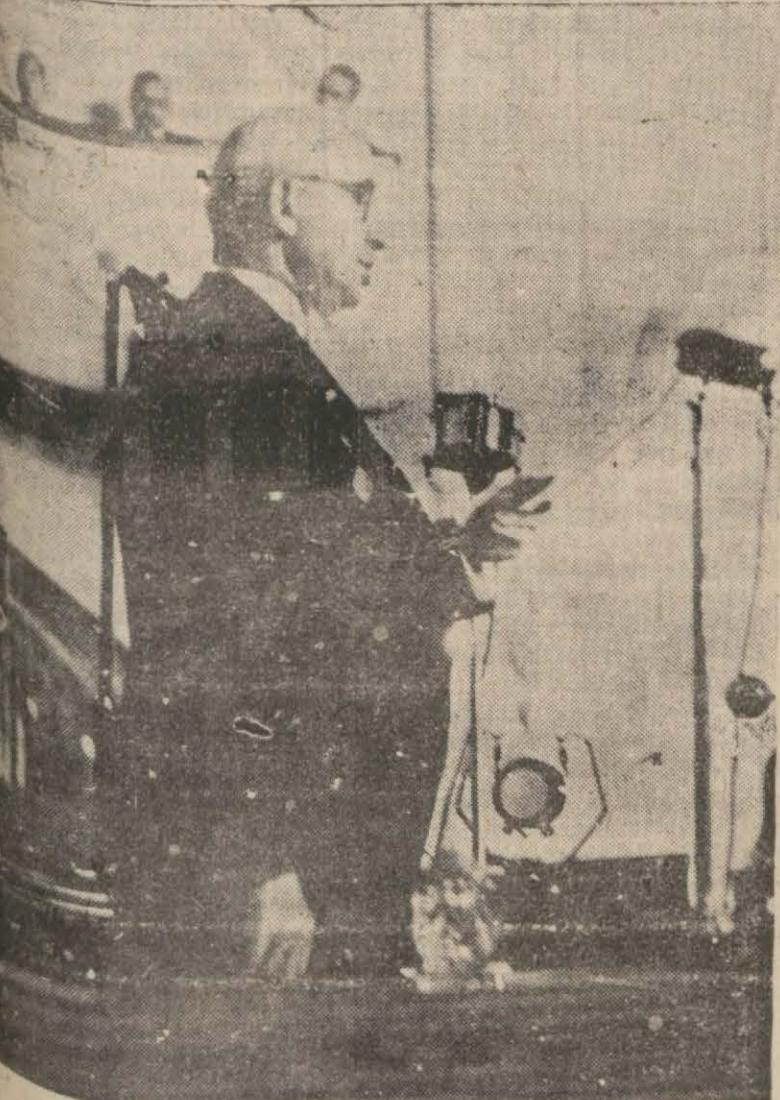
Millî Şef evvelki gün nutuklarını söylerken...

Hükümetin en isabetli tedbirleri alacağı hususunda vatandaşların güveni taandır