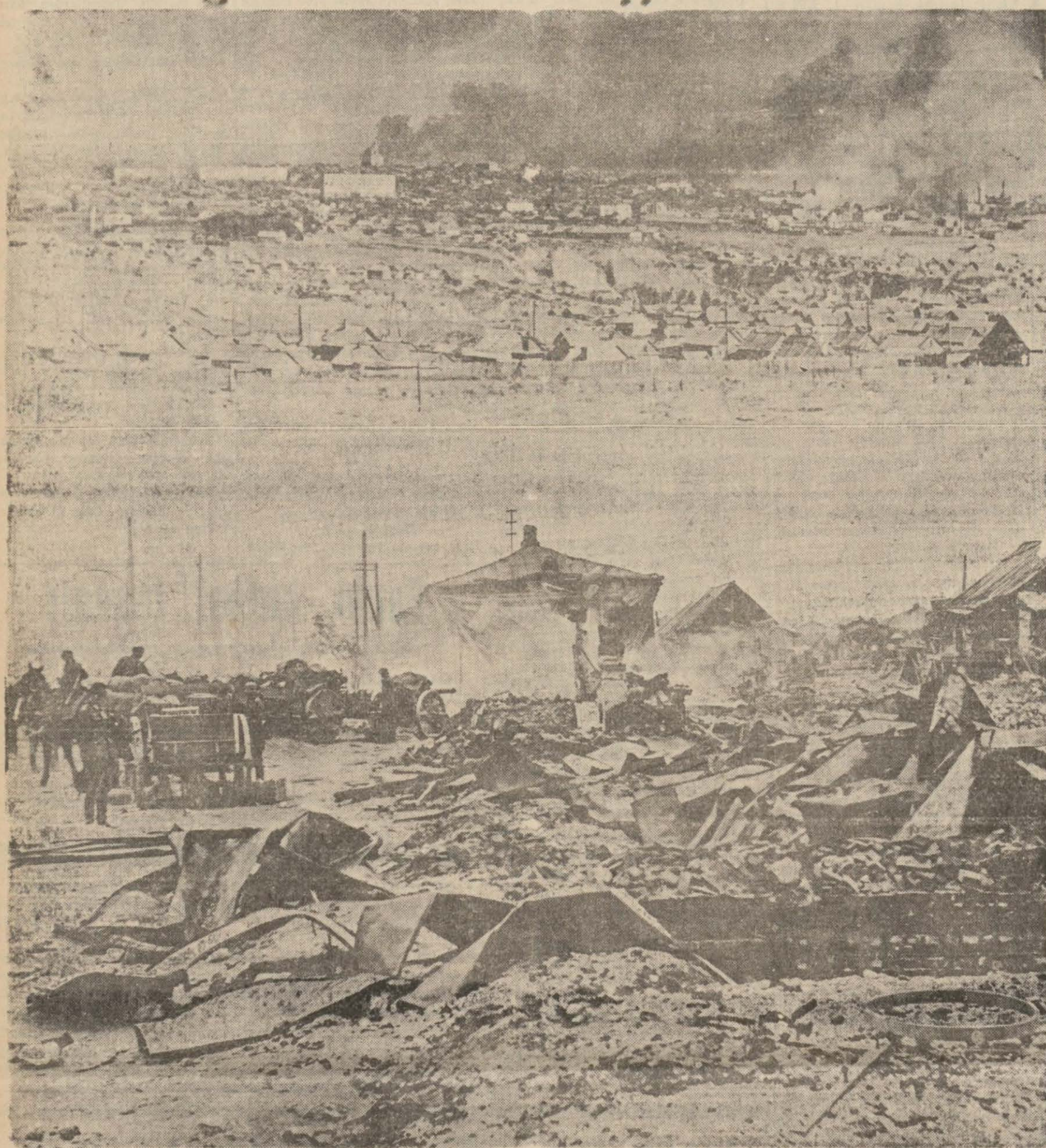
Aylardanberi mütemadi hücumlara maruz bulunan ve içinde sağlam tek bina kalmadığı bildirilen Stalingrat da dağır son iki resim... Yukarıda şehrin bombardımanlar altında umumi görünüşü, aşağıda dış mahalle sokaklarından birinin enkaz yığınlarından farksız halli..