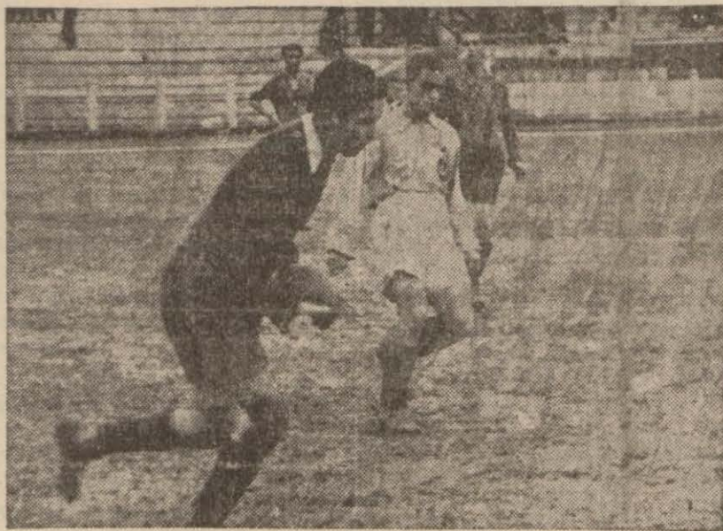
İstanbulspor — Davutpaşa maçında bir görüşü...

Fenerbahçe, Vefa, İstanbul spor, Beykoz, Taksim rakiplerini yenerek tasfiyeye uğrattılar Sahaya 5 dakika geç gelen Süleymaniye Halice hükmen mağlûp oldu