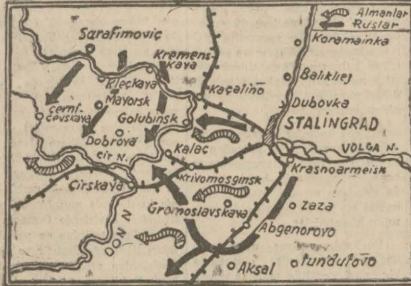
Stalingrad mntakasında ve Don nehri derişğinde Sovyet taarruzunun inkısaflarını gösterir harita...

Hususî tebliğ Londra, 25 (A.A.) — Moskova dün gece, üçüncü defa olmak üzere hususî bir demec neşretmiştir. (Devamı Sa. 4 S. 3 de)