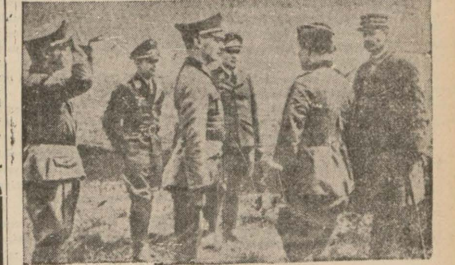
Şimalî Afrikada Fransız ordularının başkomutanı olan general Jiro (sağda) 1940 da Almanlar tarafından esir edildiği sırada.. (Yazısı 4 üncüde)

Burada mihverin 70 bin kişi toplıyabileceği tahmin ediliyor DENİZ MUHAREBELERİNDE Almanlar 89 ticaret gemisi ve 3kruzazör batırdıklarını bildiriyorlar