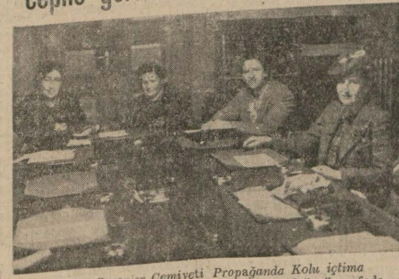
Yardım Sevenler Cemiyeti Propaganda Kolu içtima halinde.. — Yazısı 3 üncü sayfa —

Avrupa kıtasındaki Alman hâkimi- yetini kıymetten düşürür. Onun için cihan efkârı umumi- yesi Balkanları istila eden, fakat şimali Afrika'da İskenderiye ve