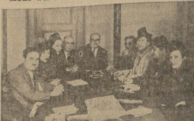
Çocuk Esirgeme Kurumu merkez heyeti iğtima halinde

Çocuk Esirgeme Kurumu İstanbul mer- kezi bu hususta tetkikler yapıyor