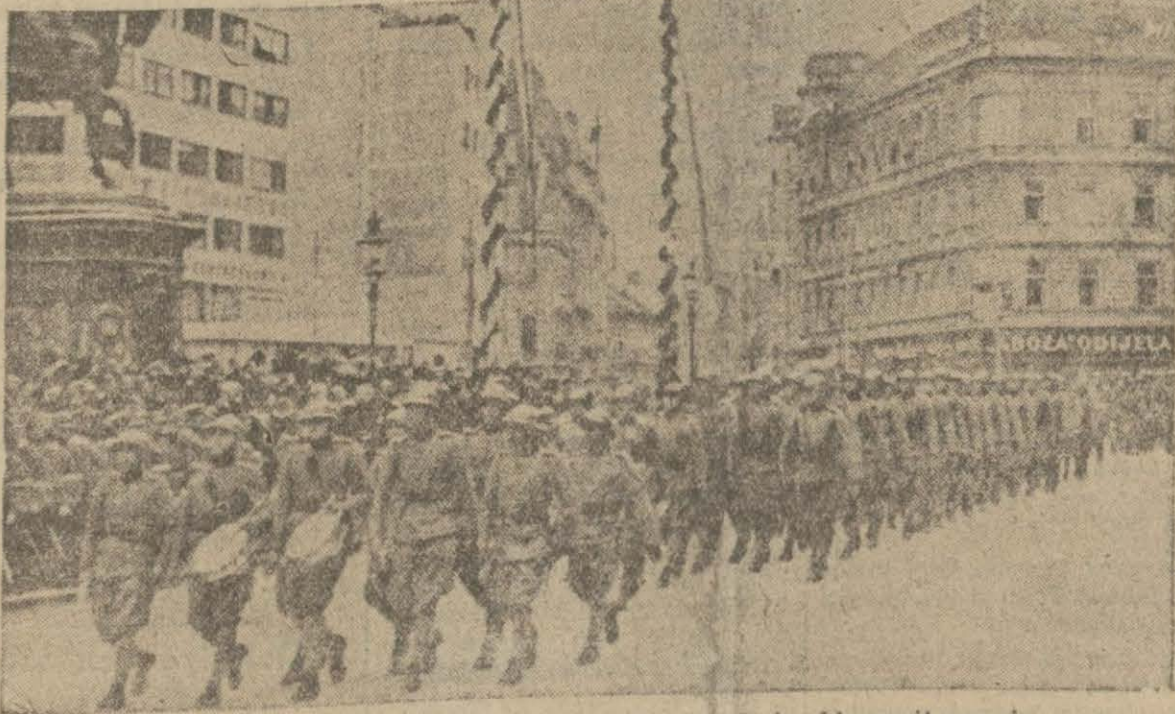
Seferberlik hazırlıkları yapılan Yugoslavyada askerlerin bir geçit resmi...

Ajans haberlerine göre Bulgar hariciye nazırı Popovun yakında istifa etmesi beklenmektedir. Baş- vuru Pilot hariciye nezaretini de üstüne alacaktır.