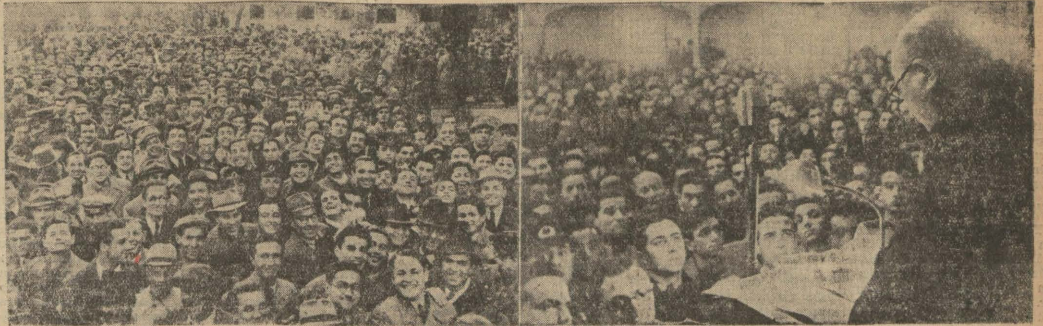
Meclis Reis Vekilimiz Şemseddin Günaltay Türk gençliği önünde konferans veriyor — Sokakları dolduran binlerce gençlerin bir gr...