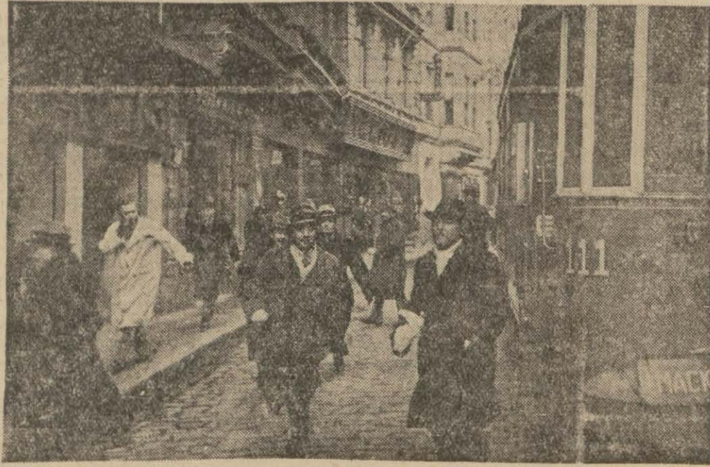
Alârm verildikten sonra tramvaydan inen halk sığmağa gidiyor

Bununla beraber arada geçen yedi ay zarfında Fransanın vaziyeti değişmiştir. İlk zamanda hakikaten mihver devletlerine karşı tam bir teslimiyet ifade eden Fransız — Alman ve Fransız — İtalyan mütarekeleri şimdi hukukî manada bir mütareke mahiyetini almıştır. Bunun sebebi Libyada İngiliz taarruzu ile İtalyanın mağlûp edilmiş olması, İtalyanın Afrikadaki üzerindeki müstemlekelerinin icabında İngilizlerle birleşebilecek bir kuvvet mevkiline gelmesidir. Onun için Mareşal Peten bütün Fransız mebuslarından ve memurlarından şahsına karşı istediği merbutiyet (Devamı 4 üncüde)