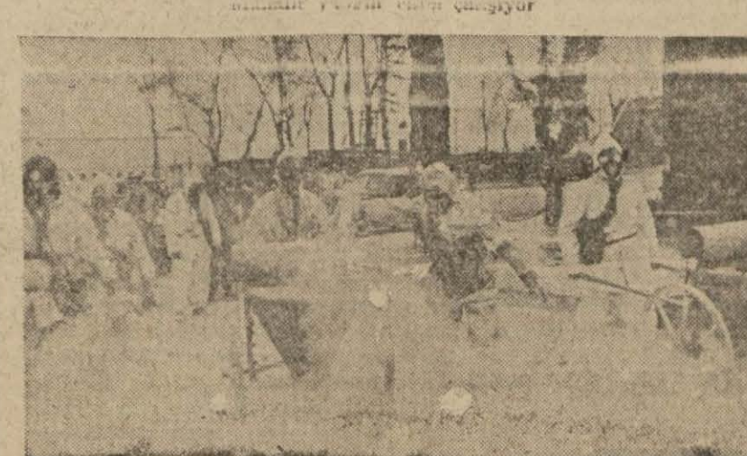
Bir zehirli gaz söndürme ekibi çalışıyor