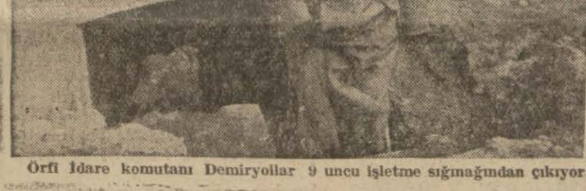
Örfî idare komutanı Demiryollar 9 uncu işletme sığmağundan çıkıyor

Örfî idare komutanı Artunkal diyor ki: Türk milletinin meziyet ve hasletleri bir defa daha tezahür etmiştir ve edecektir