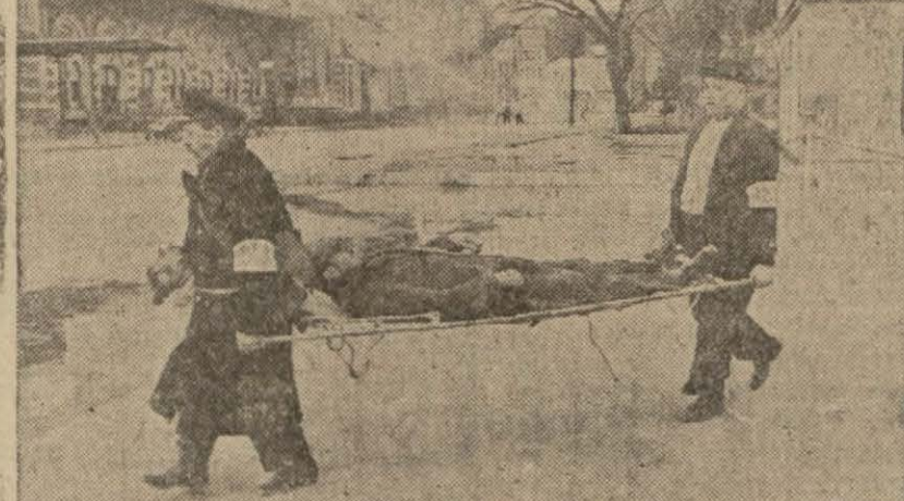
Bir yaralı sedye ile nakledilirken