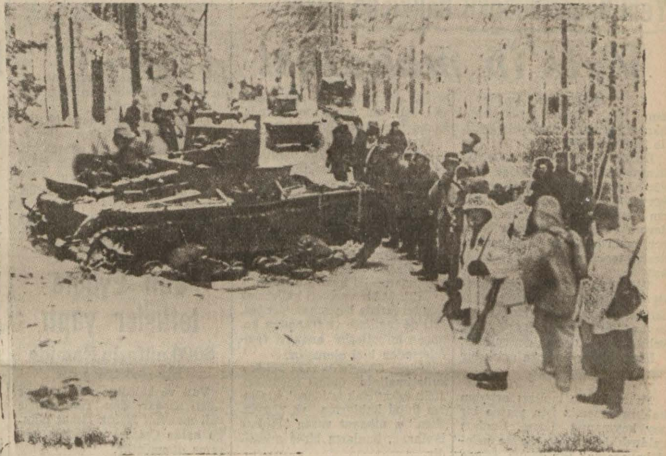
Finler tarafından iskat edilen bir Sovyet ağır tankı

refik saydam hükûmetinin 19 şubat hususî bir iltizam ile ihtar ettiğini zannetmiyorum; fakat birkaç gün sonra her halkemizde ve her halk okuma odasında bir kutulama şenliği uyanıracak olan bir güzel temel, takvimde yine böyle bir 19 şubat gördüğümüz gün atılmıştır; millî korunma kanununun ilk adım atıldığı günün halka giden bir teşebbüse ait yıldönümüne tesadüf etmesini uğur saymakta zarar yoktur. (Devamı 2 incide)