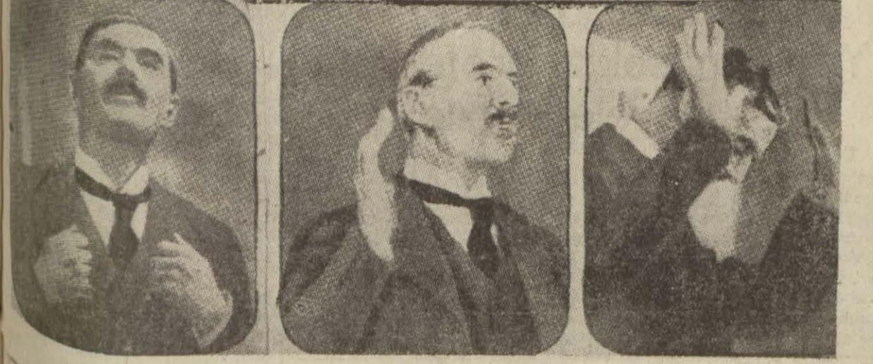
Çemberlayn'ın Avam Kamarasında izahat verirken alınmış üç poz

"Aramızda kavgalar çıkarmaktan, tefrikalar yaratmaktan çekinelim," Muhafif işçi reisleri bugünkü hükümetin işbaşından çekilmesini istediler