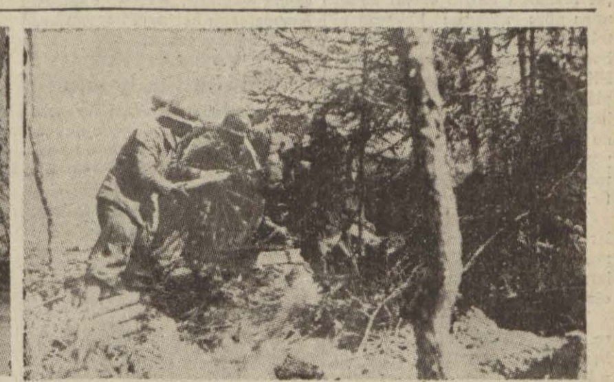
Alman ileri hatlarında tel örgü leri kesen Fransız askerleri — Almanların ateşine mukabele eden bir Fransız topu