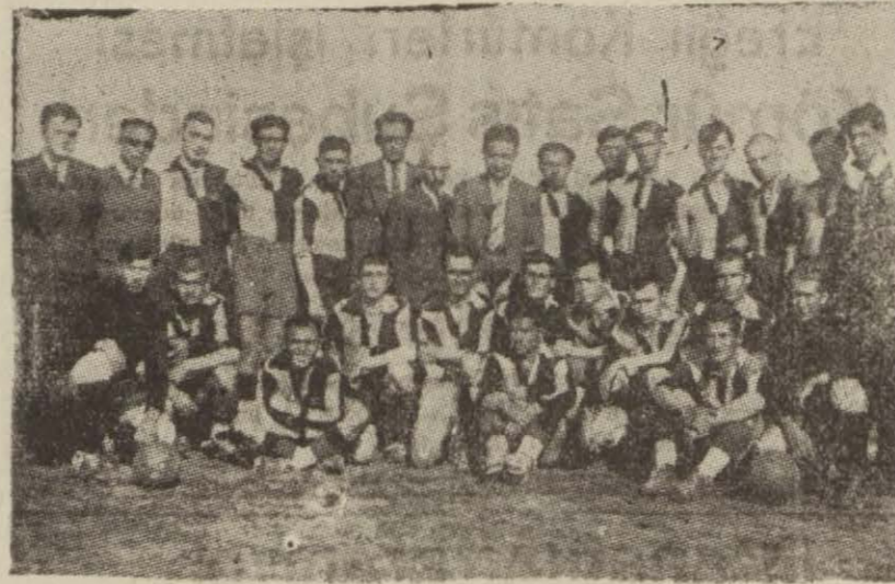
Uşak Turan — Simav Gençler

Kütahya bölgesi 1939.40 mev- simi lık maçlarının ikinci devri 5.5.940 pazar günü saat 16 da şehir stadyumumuzda dört bi- ni mücadelede bir seyirci kütle- sinde Simav Gençler Birliği — Uşak Turan İdman Yurdu takımları arasında yapıldı. Turan İd- man Yurdu maçı 7 - 3 kazandı. Maçın her iki devresi de büyük bir dikkat ve alâka ile takip olun- muştur.