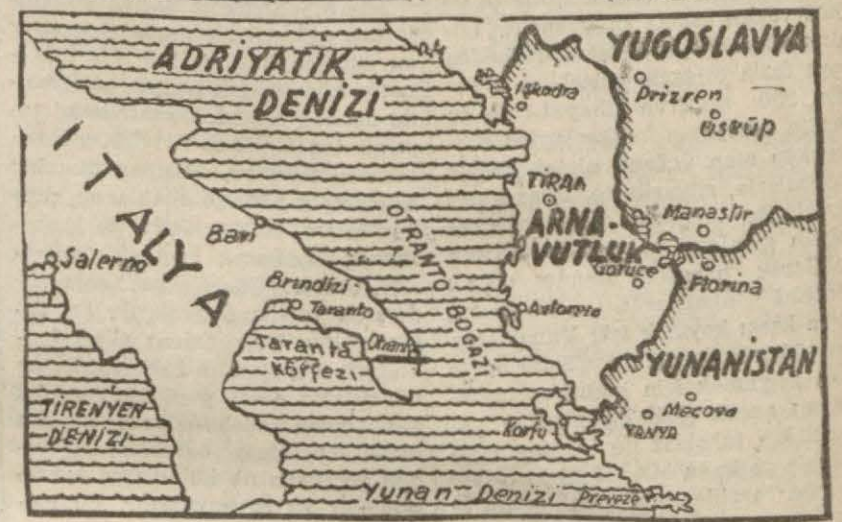
Otranto deniz üssünün yerini gösteren harita