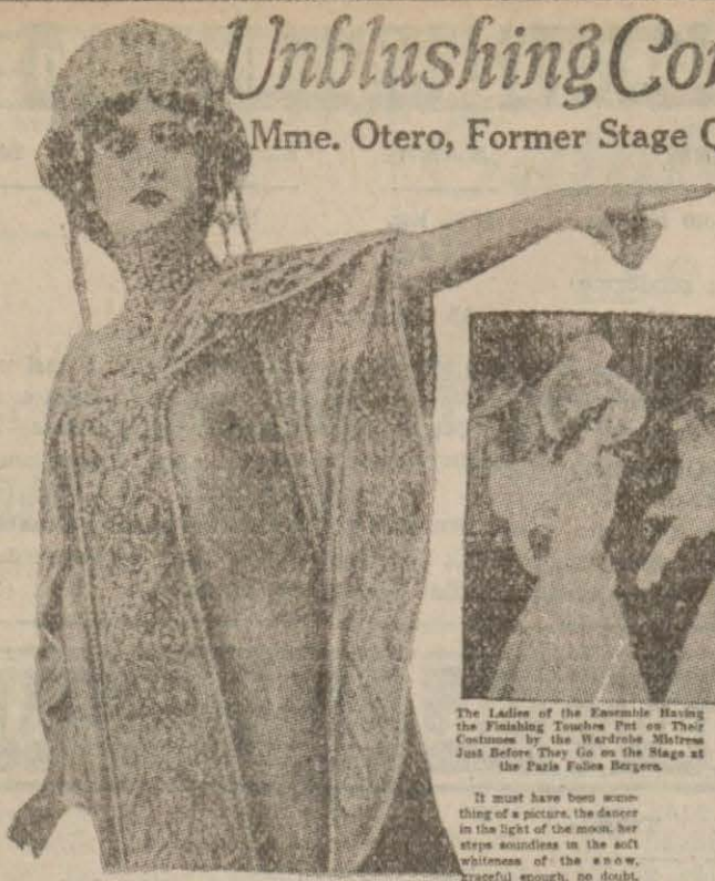
La Belle Otero in a Dramatic Pose.

Mme. Otero, Former Stage Queen, Reveals With Astonishing Frankness How She Made Her Rich Lovers Pay for Her Favors and Then Foolishly Tossed Away Her Money and Jewels as Fast as She Acquired Them