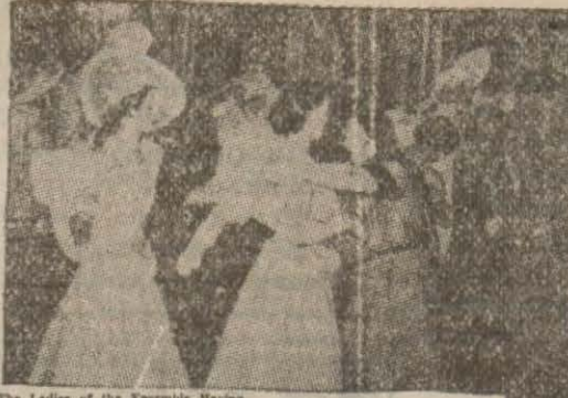
The Ladies of the Ensemble Having the Finishing Touches Put on Their Costumes by the Wardrobe Sisters Just Before They Go on the Stage at the Paris Folies Bergere.

With a frankness hardly to be matched elsewhere, Madame Otero, tonight's favorite of a generation ago, has told the story of her extraordinary life—a stage star and a calculating adventuress. But if La Belle Otero beguiled rich men and sold her charms to them for jewels and money, she pursued the pretty Spanish dancer and stripped her of the profits of her adventures. "Ever since my childhood," says Otero, "I have been accustomed to see the face of every man who passed me with desire. Many women will be disgusted to hear that I have taken this as a badge. It is so desirable to be the focus of desire that people long to be so. I have been so since I was a child." La Belle Otero followed that policy of life and she now finds herself a rich woman and a famous actress. Four months ago, Otero lists of men who killed themselves on her account, but how many times she looks up, how many lovers were driven to suicidal ruin to win her smiles, she does not say. Otero's memoirs printed in these pages preach their own moral lesson.