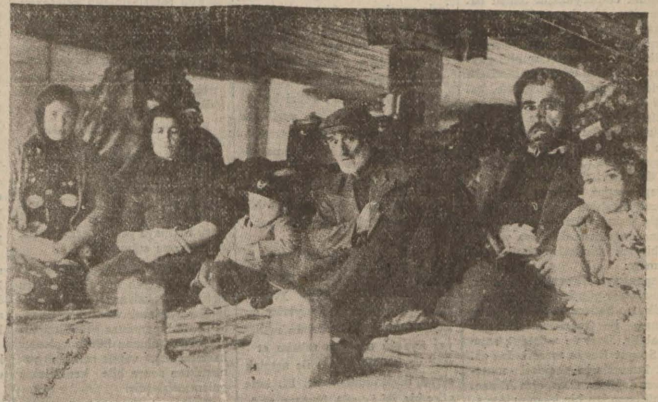
Ahırkapıdaki misafirhanede istirahat eden felâketzedeler

Ankara, 10 (A.A.) — Dost ve müttefik Elen hükümeti Anadolu zelzelesi felâketzedeleri için on bin lira yardımda bulunmağı kararlaştırmış, bunun nakden mi, sıhhi malzeme olarak mı gönderilmesi istendiğini Ankaradan istinzaç etmiş ve bunun üzerine hükümetimiz de sıhhi malzemeyi tercih eylemişti. Bu defa öğrendiğimize göre, Elen hükümeti hem nakden on bin lira, hem de ayrıca on bin lira kıymetinde sıhhi malzeme teberru edeceğini ve ayrıca bütün Yunanistanda Anadolu zelzelesi felâketzedeleri için para toplamak komiteleri teşkil olduğunu bildirmiştir.