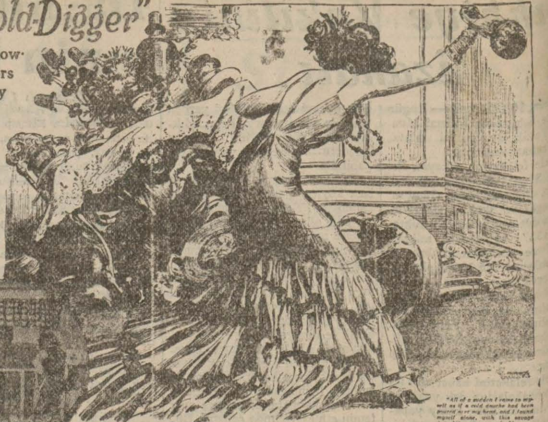
"All of a sudden I came to myself as if a cold shower had been poured over my head, and I found myself alone, with the except"

With a frankness hardly to be matched elsewhere, Madame Otero, tonight's favorite of a generation ago, has told the story of her extraordinary life—a stage star and a calculating adventuress. But if La Belle Otero beguiled rich men and sold her charms to them for jewels and money, she pursued the pretty Spanish dancer and stripped her of the profits of her adventures. "Ever since my childhood," says Otero, "I have been accustomed to see the face of every man who passed me with desire. Many women will be disgusted to hear that I have taken this as a badge. It is so desirable to be the focus of desire that people long to be so. I have been so since I was a child." La Belle Otero followed that policy of life and she now finds herself a rich woman and a famous actress. Four months ago, Otero lists of men who killed themselves on her account, but how many times she looks up, how many lovers were driven to suicidal ruin to win her smiles, she does not say. Otero's memoirs printed in these pages preach their own moral lesson.