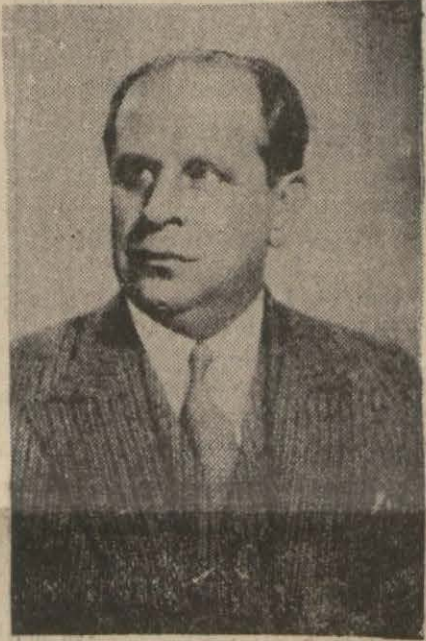
Ticaret Vekili Nazmi Topçuoğlu

faaliyet göstermemiştir. Münhasıran birlikler işiyle meşgul olmak üzere yeni tayin edilen birlikler umumî kâtibinin tetkikatını bitirdikten sonra müsmir bir faaliyetin ihtiyacı göstereceği tedbirleri alacağına şüphe yoktur. Bugüne kadar görülen ufak tefek aksaklıkların tekrarı etmemesine çalışmakta olduğumuz gibi ithalât birliklerinin vazife ve rollerini (Devamı 4 üncüde)