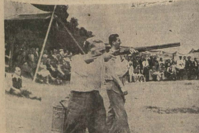
Derece alanlardan biri atış esnasında (Yazısı 3 üncüde)

Avcılar bayramı dün Sarayburnunda kutlandı