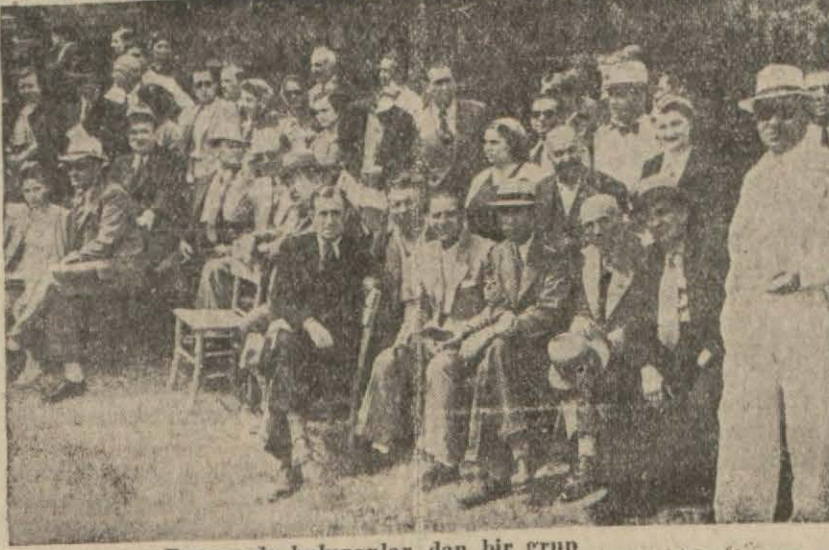
Bayramda bulunanlar dan bir grup

Avcılar bayramı dün Sarayburnunda kutlanmıştır. Avcılar ve atçılar cemiyeti mensupları ile davetliler sabah saat 10 da Sarayburnunda toplanmışlardır. İstiklâl Marsili merasime başlanmış, müteakiben bayrak çekme töreni yapılarak parktaki Atatürk ântına çelenk konmuştur. Bundan sonra cemiyet reisi Atif, avcılık hakkında bir nutuk vermiş ve davetliler gazinoda hepisi beraber av yemeklerle güzel