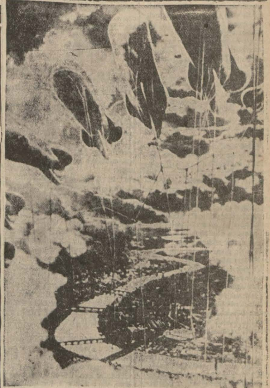
Londra etrafındaki balon barajları

Bu netice, Büyük Britanyanın resmî tebligatından istihraç edilmiş olup, hakikaten kaybolmuş olan miktarın yüzde altmışını göstermektedir.