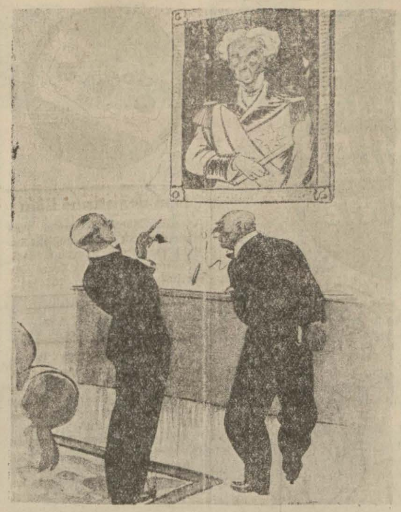
— Ya.. Demek ki bu zat sizin büyük pederiniz.. Fakat hayret!.. Waterloo muharebesinde gaz maskesi kullandıklarını bilmiyordunuz.. (İngiliz karikatürü)