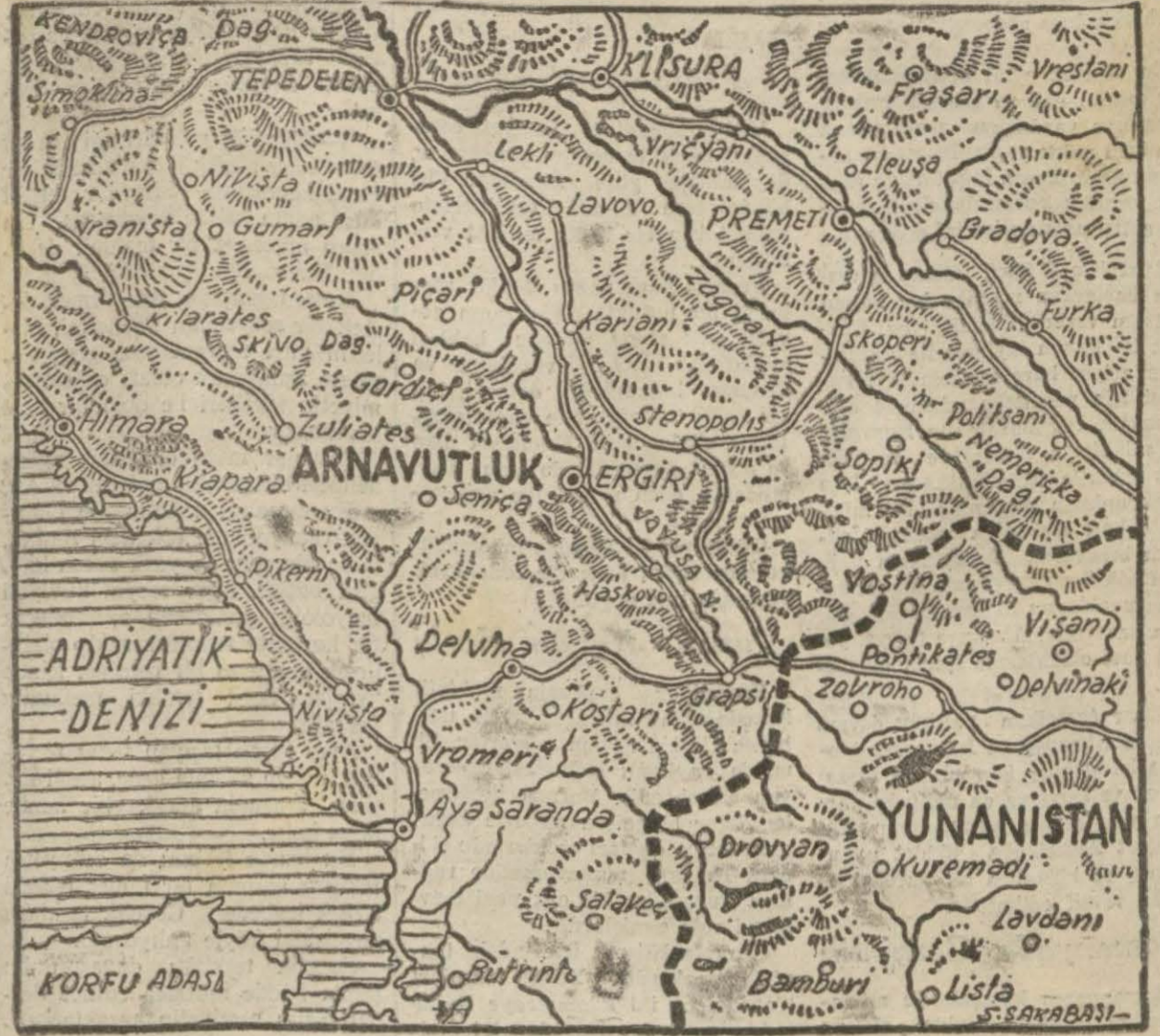
Yunanlılar tarafından işgal edilen Himara ve civarını gösteren harita

Şeker fabrikaları- nın çalışmaları sona erdi İstihsalât doksan bin ton