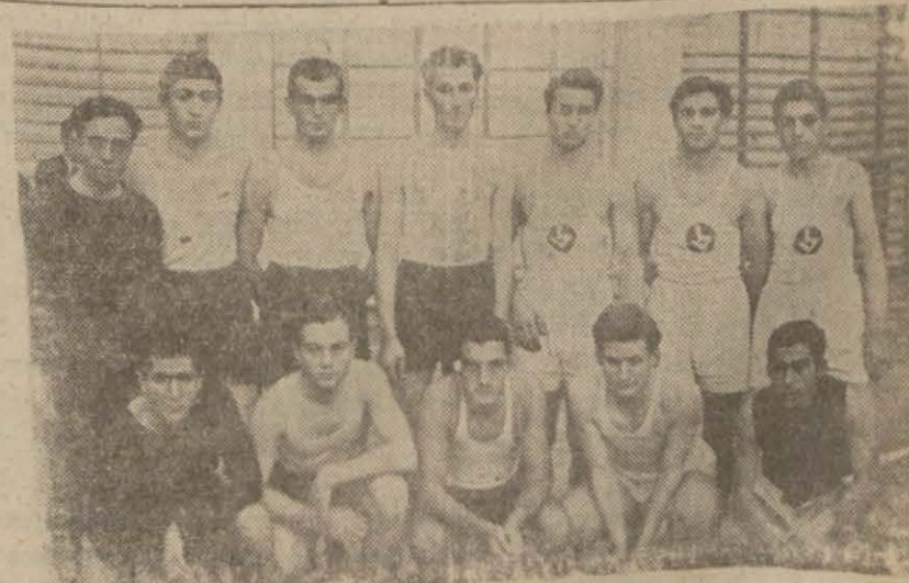
Erkek mektep- aramızdaki dün yapılan voleybol müsabaka- larında Vefa - Yüce Ülke liseleri takımları bir arada