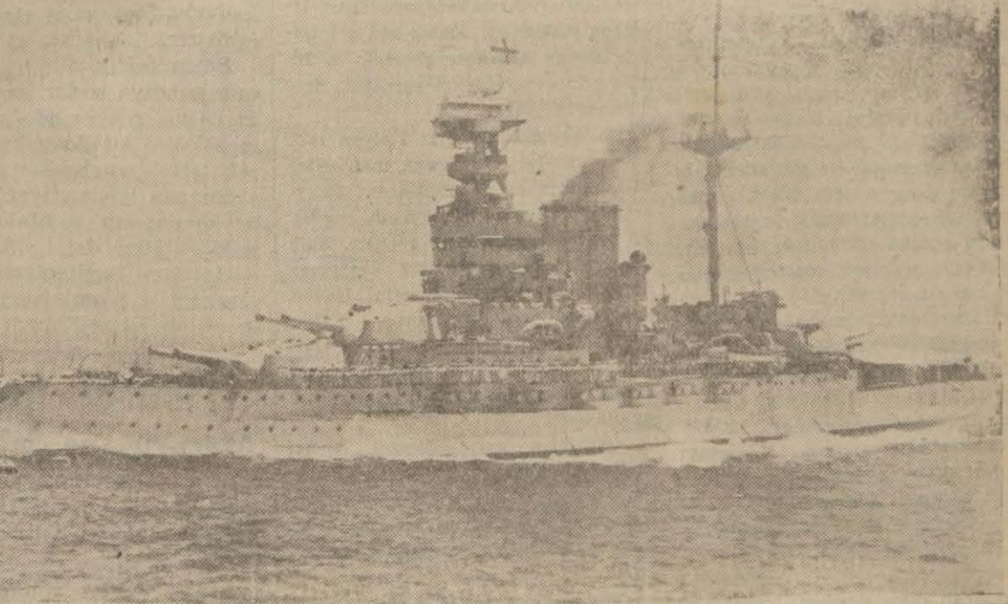
İngiliz donanmasının kuvvetli harp gemilerinden Küin. Elizabet arhısı

Berlin, 13 (A.A.) — Yaban- cı basın müessesileri huzurun- da Hitler ile Musolini aram- da yakında bir buluşma vukua geleceği hakkında Berline hiç bir malumat olmadığını bildi- ren Alman hariciye nezareti sözcüsü, diğer yabancı devlet adamlarının yakında Almanva- rı ziyaret edeceklerine dair ha- berler hakkında da aynı beya- natta bulunmuştur.