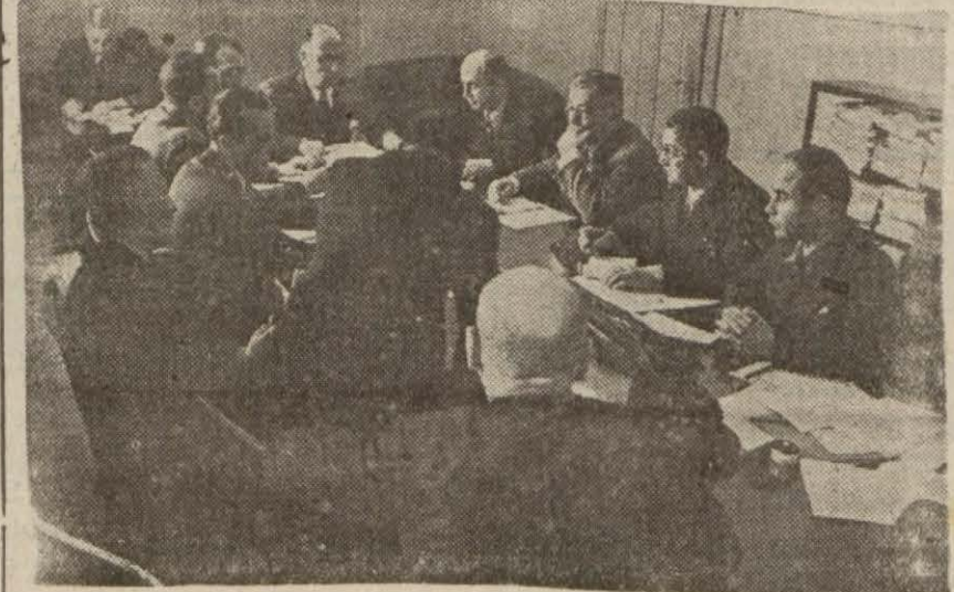
Fiyat murakabe komisyonunu toplantıda

"Burada pil yoktur,, levhasını asanların dükkânları ansızın basılacak