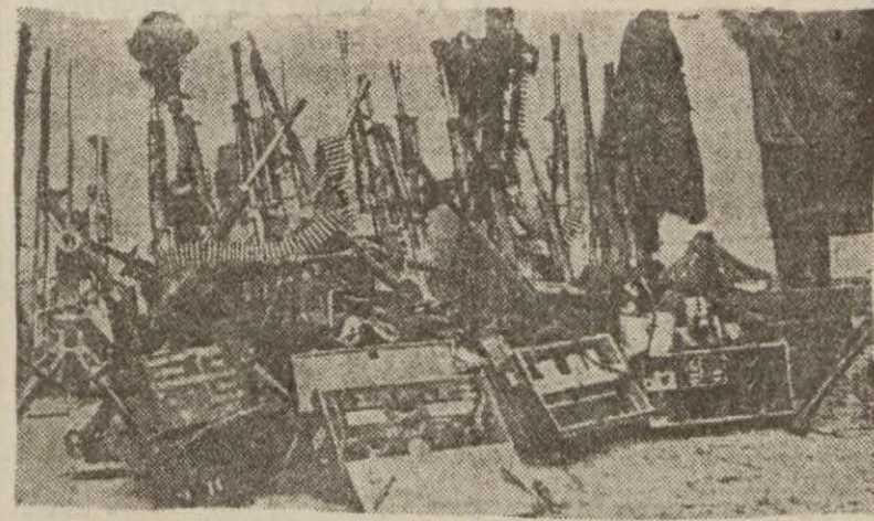
İtalyanlardan iktinam edilen silâhlar