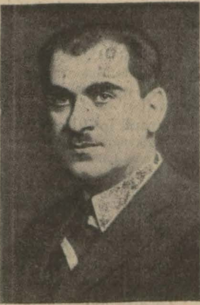
Maarif Vekili Hasan Âli Yücel