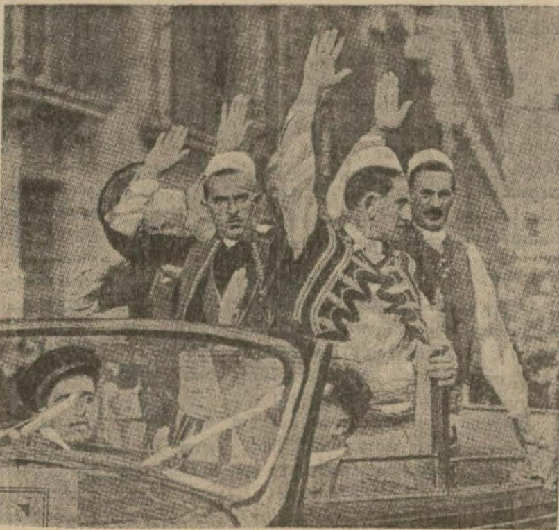
Arnavutluk tacmı İtalyan Kralına getiren Arnavut heyeti Romada Faşist selâmı veriyorlar.

Ankara, 20 (Hususî) — Sümer Bank porselen fabrikası yerine bir şamot fabrikası kurmaya karar vermiştir. Bu fabrika ya İstanbul'da ve yahut ta Kültahyada kurulacaktır. İnşaat projelerinin hazırlıkları başlamıştır.