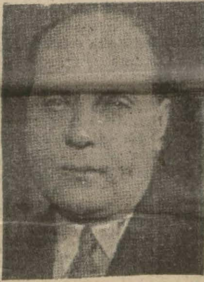
Bulgar Başvekilü Köse İvanof

Yalnız bu antant içinde Yu- goslavyanın isminin zikredilmiş olmasını anlamak müşküldür. Eğer olsa, bu ittifakın mantığı- na göre, (Devamı 6 ncıda)