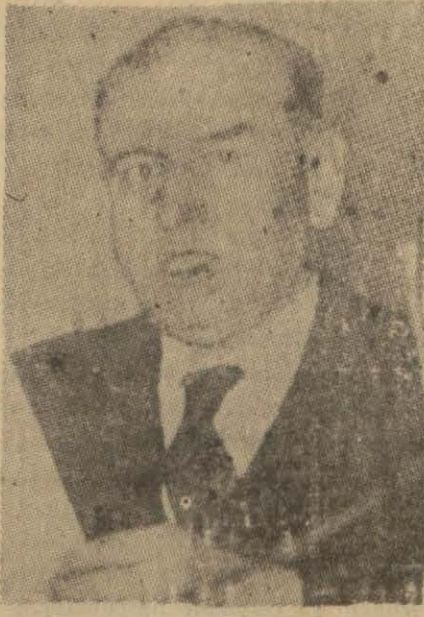
Fransız Başvekili Daladye