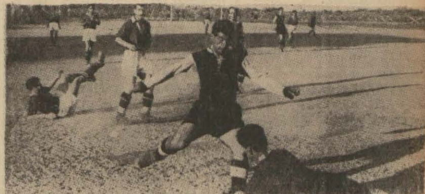
Dünkü Beşiktaş - Doğanspor maçından heyecanlı bir an.. (Spor yazılarımız 7 incisayfamızdadır)