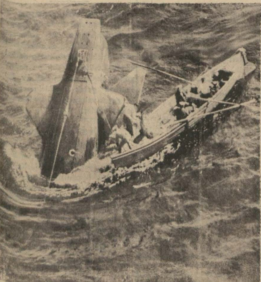
Feliks denizaltı gemisinin neticesi 3 kulan kurtarmâ ameliyesinden bir görünüş (Yazısı 3 üncüde).