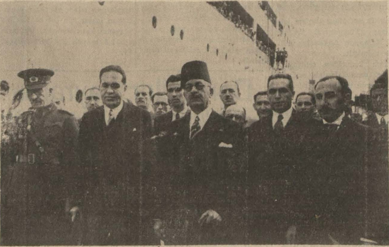
Muhterem misafirimiz kardeş Mısır Hariciye Nazırıle kendisini karşılayanlar, Mısır ve İstanbul (Yazısı 6 üncüde).

Bugün reiscumhurumuz tarafından kabul edilecek olan misafirimiz, gazetecilere verdiği beyanatta "emelimiz asırlık rabıtamızı takviye etmektir," dedi