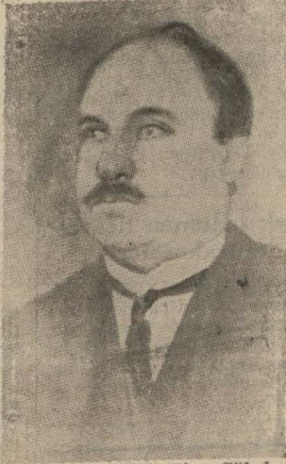
Şair ve mütefekkir Ziya Gökalp