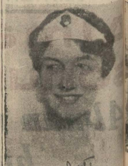
Memleketi bugünlerde idare eden Düşes Şarlot

Almanların çignemek ihtimali olan Lüksemburg Dükalığı nasıl idare ediliyor?