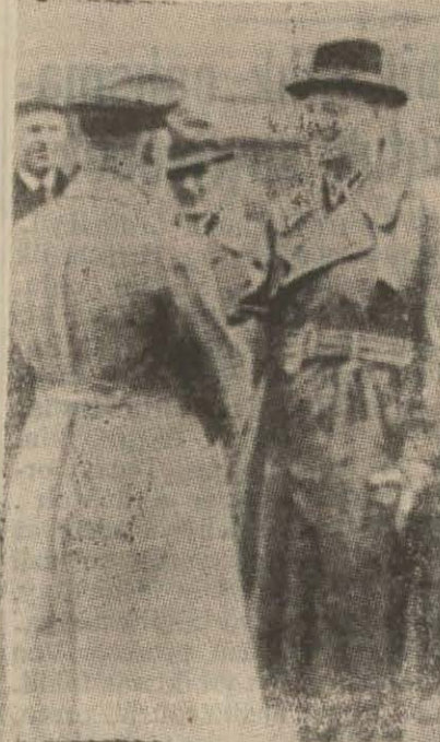
Ribbentrop Moskova'da bir Sovyet generaliyle konuşuyor

Fakat bütün bu sulh cereyanları kuvvet aldığı bir kaynak değildir ki bu da bir taraftan Türk ve Fransız yardım pakiti, diğer taraftan Türk - Rus yardım