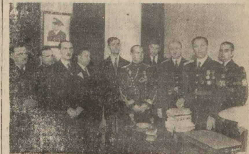
Lânkü resmîkişâda bulunanlar (Yazısı 3 incede)