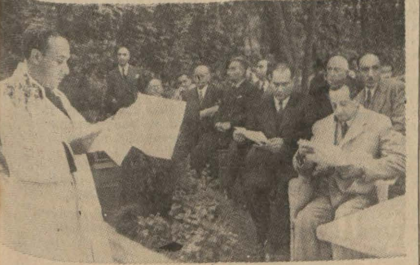
Dünkü merasimden bir görünüş

Esnaf cemiyetleri tarafından kurulan Esnaf Hastanesinin birinci tesis yıldönümü dün merasimle kutlanmıştır.