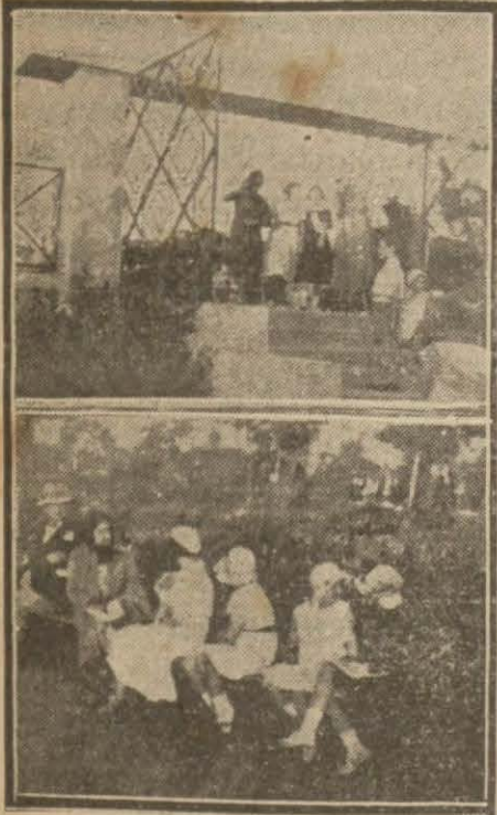
Meclis bahçesinin kapısında ve içeride gezintiler..

Birde kurak Ankarada nereyi gezeceksin? derler. Neresi kurak?