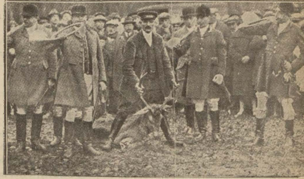
Bir av sonu

Bizde pek az tanınan binili sürek avı kadar zevkli ve zarif bir spor yoktur. Bundan yirmi beş, otuz yıl evvel Büyükdere çayırında İngilizlerin oynadığını görüp eşittiğimiz Polo oyunu gibi sürek avı da büyük harp esnasında, at meraklısı bazı devlet ricalinin teşvik ve himmetile bir kaç defa yapılmış, fakat devam ettirilemediğinden taammüm edememiş ve bu gün tamamen unutulmuştur.