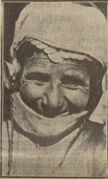
Bir Bedevî kadın kulaklı radyo ile Parisi dinliyor!

İngilterede 200 polis cebindeki telsiz telefonla konuşuyor!