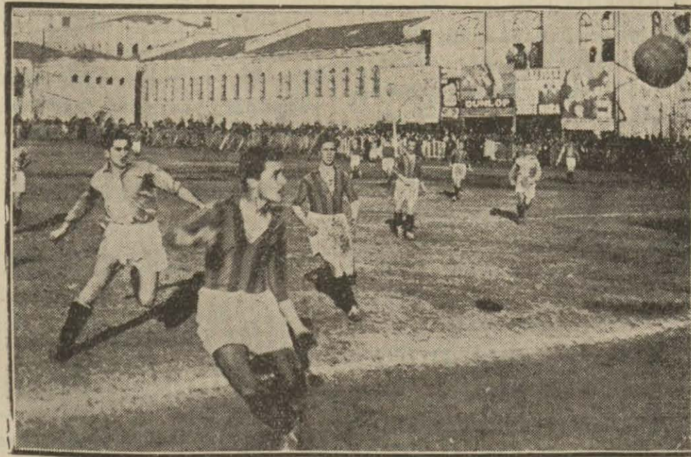
Kaleciye biten bir Fener hücumu