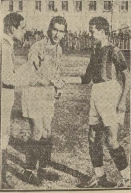
Hâkım ve iki tarafın takım kaptanları