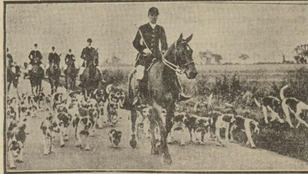
Bir av kafillesi

Sürek avının menşei İngilteredir. Bir kaç düzine Kopya, bir o kadar ata sahip zengin lortlardan; bir at ve bir iki kopoy sahibi köylülere varıncıya kadar bütün İngilizler sürek avını, İngilterenin asil ve milli sporu olarak tanırlar.