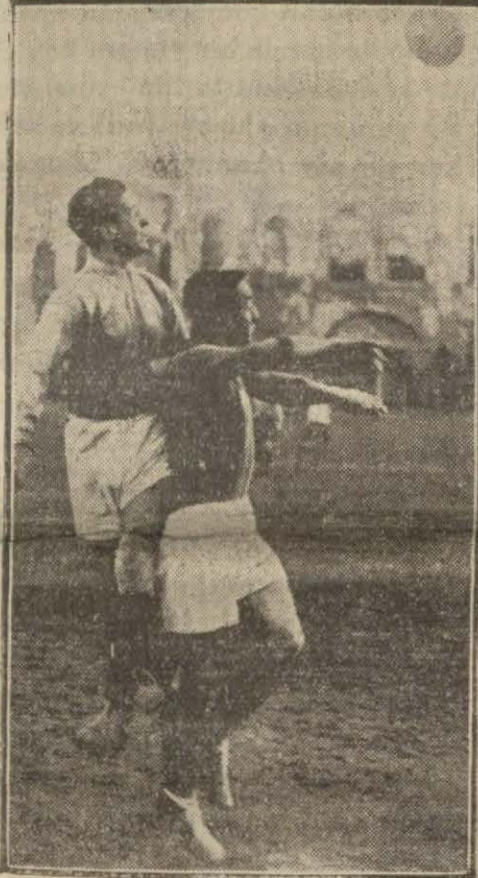
Dünkü maçta, Galatasaray kalesi önünde.