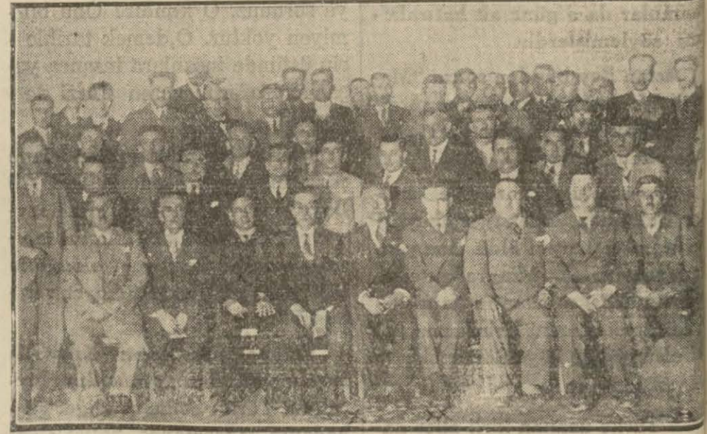
Aydın fırka kongresinde bulunan mümessiller