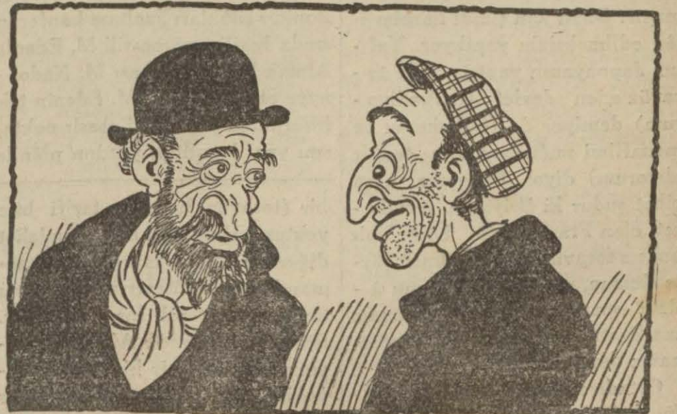
— Peki ama karını boşadın anladık, dinini ne diye değiştirdin a Hayım efendi — Bezin kârı bu dünyada da otekinde de yormeyim diye..

[Pazartesi günü forma halinde karilerimize takdime başlayacağız]