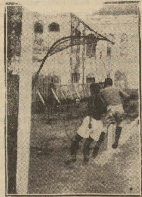
Dün Süleymaniye kalesinde gol sayılan tutuş vaziyeti

Dün iki stadda da lik maçlarına devam edildi. Taksim'de Fenerbahçeliler Süleymaniye takımını bir hayli müşkülât çektikten sonra bire karşı üç sayı ile yendiler. Kadıköy'deki Beykoz — Vefa maçı da bire karşı iki sayı ile Vefalıların galebesile neticelendi.