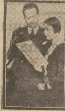
Gelecek olan iki san'atkar