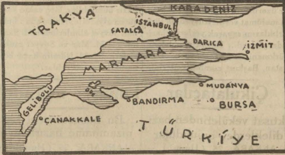
Çanakkale ve Karadeniz Boğazlarıyla Marmara, Trakya

CENEVRE, (A. A.) — Anadolujansının hususî muhabiri bildiriyor: