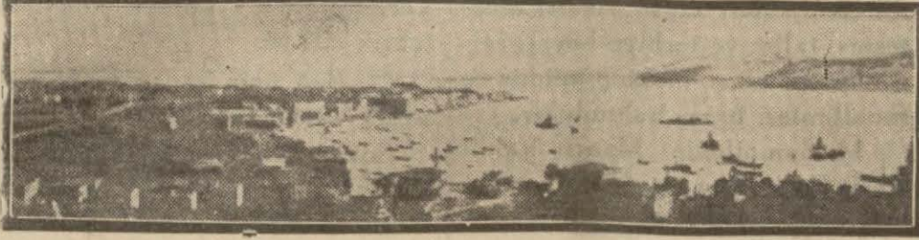
Çanakkalenin uzaktan görünüşü

Boğazlar mukavelesinin (3-9) mad - delerinde, Tahtelbahirlerin boğazlardan ancak suyun yüzünde geçecekleri, boğazdan geçecek ecebî donanmanın miktarı daha evelden bir işaret istasyonuna bildirileceği; tayyarelerin ancak 5 kilometrelik dar bir şerit üzerinden geçebileceği, boğazlardan geçen gemilerin geçmeleri zamanından daha fazla zaman boğazlarda demirlemeyecekleri, gemilerin beynelmîl şhî şartlara tâbi olmaları, Çanakkale ve Karadeniz boğazlarında gayri askeri hale ifrag edilcek sahaları, Marmarada tahtelbahirlerden başka denizaltı işliyen alet bulunmayacağı, gayri askeri hale ifrag edilmiş olan mıntakalarda ve adalarda istihkâm ve daimî topçu tesisatı ve askeri tayyare tesisatının bulunmayacağı hükümdür.