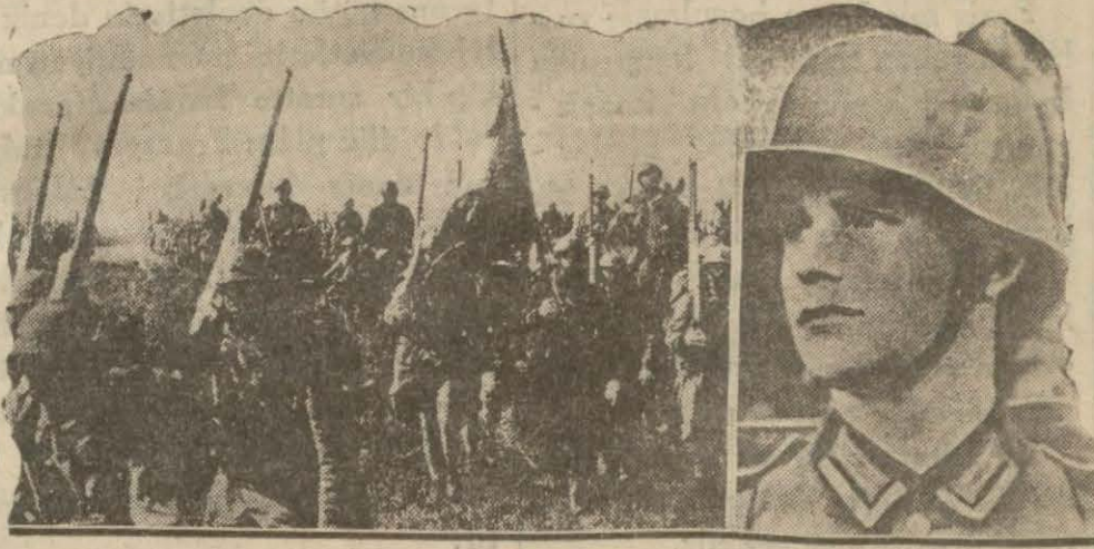
Fransız askeri yekünü 600 bin !