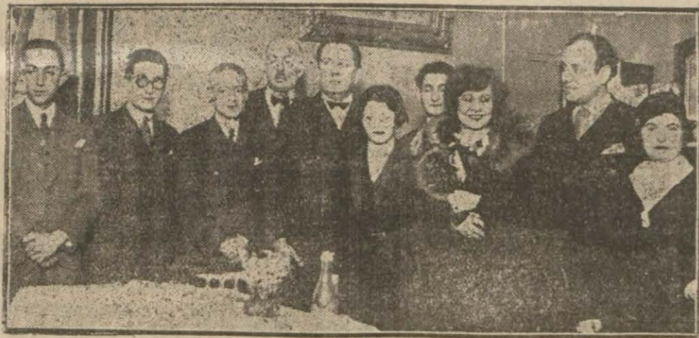
Dünkü çay ziyafetinde sanatkarlar ve misafirleri