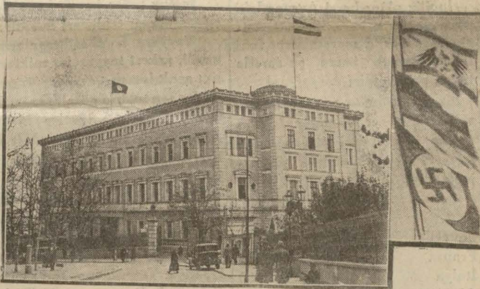
Alman konsoloshanesinde dün çekilen bayraklar Kabul edilen Alman bayrakları