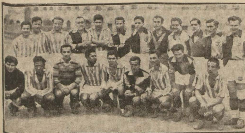
Dünkü maçta Vefa - İstanbulspor takımları bir arada