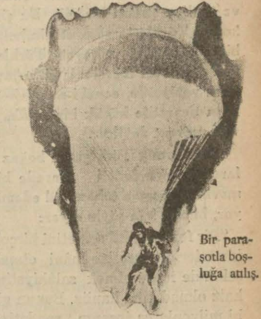
Bir paraşütla boşluğa atılış.