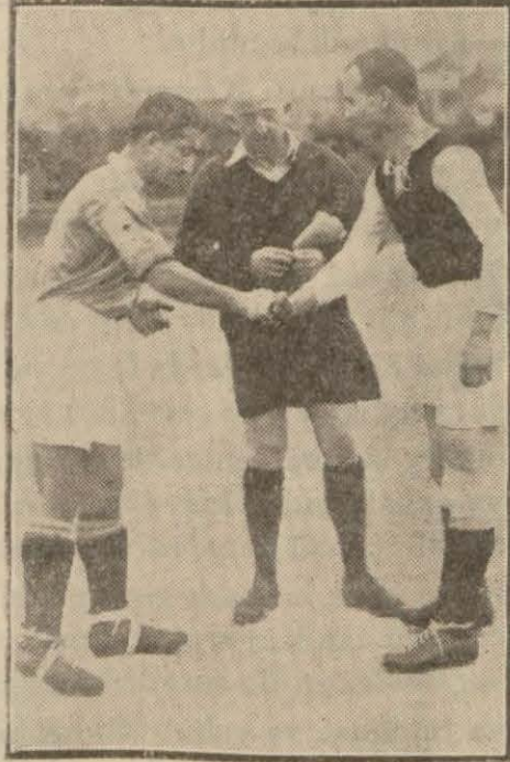
iki taraf kaptanları hakemle beraber