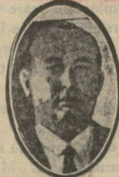
Macar başvekil M. Gömböş

Evvelki gün Peşteden şehrimize doğru hareket eden Macar başvekil böyle söyledi.