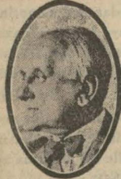
Macar hariciye nazırı M. Kanya

(M. Gömböş'ün beyanatı 9 uncu sayıfamızda)