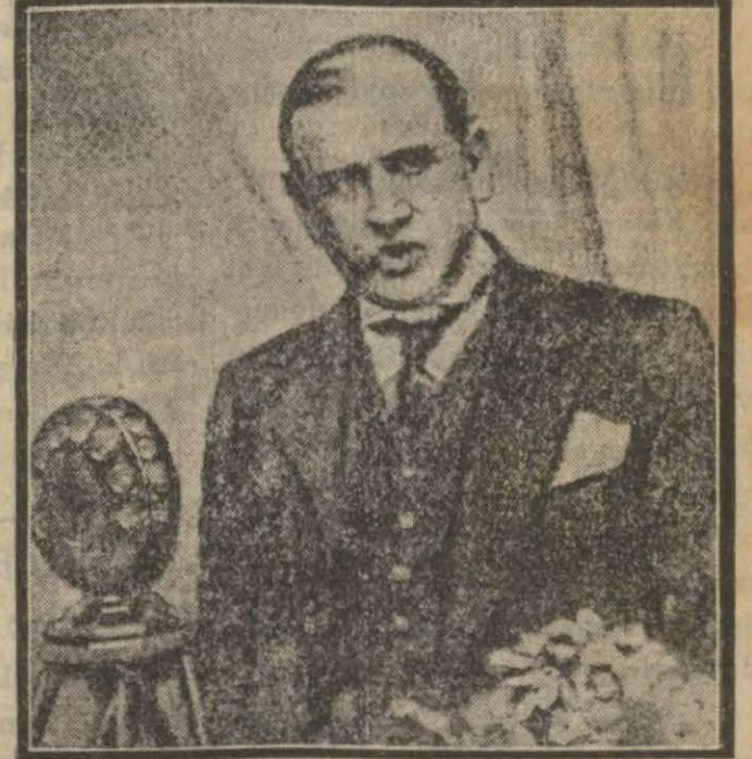
Fransız başvekil M. Daladye

dier dün mecliste verdiği bir nutukta demiştir ki: