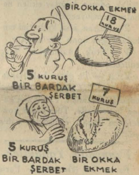
Ekmeğin fiyatları ile şerbet fiyatları arasındaki farklar

İstanbul sıcaklar geç geldi. Bu günlerin sermayesi az, ticareti bol ve kârlı işi su ve şerbetir. Her şey ucuz. İralar bile boyuna göre yüzde 25, yüzde 50 düştü. Su, meyva, dükkân kirası hepsi ucuzladı. Fakat şerbet bundan sekiz sene evel, ekmeğin okkası 18 kuruş iken olduğu gibi, gene beş kuruştur. Buzlu da olsa sermayesi kırk paradan fazla olmayan bu bir bardak şerbetin beş kuruşa satılması, bugünlerde üç, beş yüz bardak satan şu küçük köşe başı şerbetçileri için bile kârlı bir iştir.