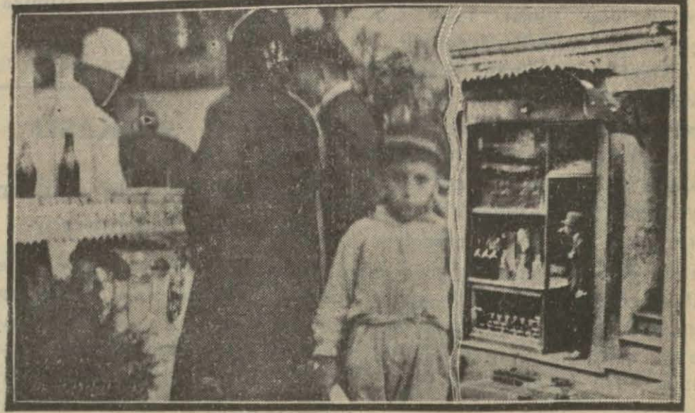
Şerbetçi dükkânlarının önü dolup boşalıyor

Sermayesi 1 kuruş olan şerbetten günde 500 ve 2500 bardak satanlar