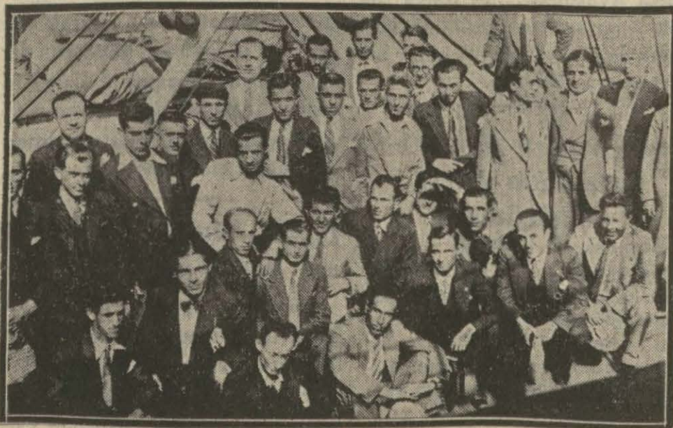
Dün giden gençler Çiçerin vapurunda

Sümer Bank tarafından Sovyet fabrikalarında staj görmeleri için Rusyaya gönderilen otuz genç dün Çiçerin vapurıyla Odesaya hareket etmişlerdir.