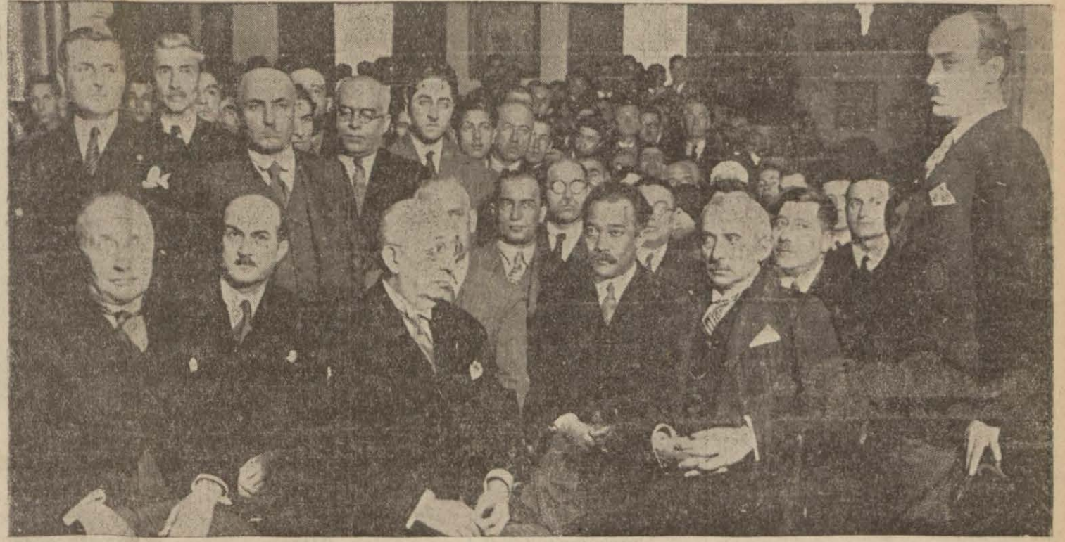
Istanbul Halk evinin açılma resmini şerefliendiren Başvekilimizle merasimde bulunanlar