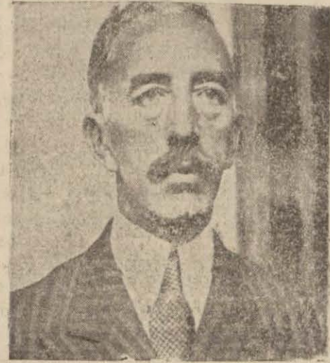
Irak kiralı Faysal Hz.