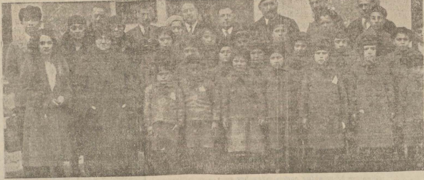
Bayramda sevindirilen Paşabahçeli yavrular

Paşabahçede, bir nümune olarak alınabilecek derecede çok çalışan ve çok hayırlı işler gören bir şefkat müessesesi vardır. Boğaziçinin güzide hanım ve beylerinden terekkep eden bu heyet her gün kırk beş fakire ek-mek, erzak, kömür dağıtır ve her fırsattan istifade ederek muhtaçlara mümkün olan yardımı yapar. Bu cemiyet kışın şiddetli geçmesi dolay-