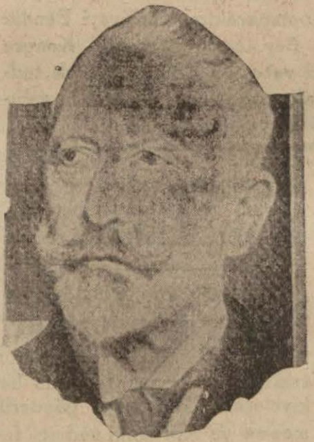
Hitler kazanırsa Almanya'ya döneceğinden bahsedilen sabık Kayser

Galibiyet, temin edilmiş demektir... Ses, meydanda çıngın ötüyor.