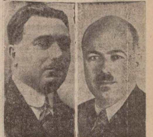
Refik B. Refik Şevket B. lif ederim.

dir. Bu doğru değildir. Memuriyet için müracaat eden bir zatı alıp almamakta ait olduğu makam muhtardır. Bu doğru olduğu halde bu takyit gayesi anlaşılabilir. Bu madde yerine masraf bir madde değildir. Inhisarlara kolaylıkla bir çok adamlar yazdırılmış ki bu tedbire lüzum görülüyor. Bu böyle olmamalıydı. Liyakatlı, liyakatsiz nemur yazıldı diye böyle bir kayıt konulmasına lüzum yoktur. Hükümet, salâhiyetine istinaf ederek istediğini alabilirdi ve bu daha muvafıktır. Muktedir mütekaillerin alınabilmesi için bu maddenin kaldırılmasını tek-