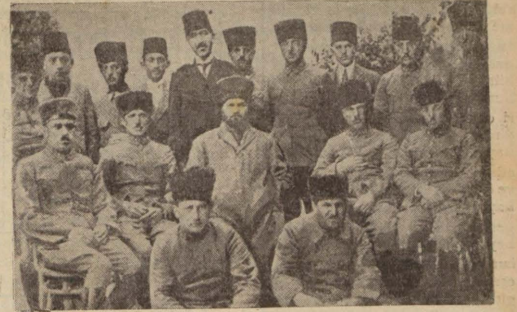
Kılıç Ali Bey, millî mücadele esnasında bazı arkadaşlarıyla birlikte

Kılıç Ali Beyin fevkalâde alâka uyandıran hatıralarının neşrine devam ediyoruz. Hatıralar, daha evvel de kaydettiğimiz gibi, henüz neşre çıkarılacak kadar tamamlanmamış olmakla beraber, Gaziantep kahramanının müsaadesile daha bazı parçalarının neşrine ve bu suretle her tarafta uyanan alâkânın kısmen olsun tatminine imkân bulduk.