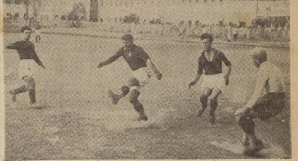
Maçtan bir görünüş

Yunanlılar müsaadesiz gelmişler .. Federasyon ve mıntaka harekete geçti!