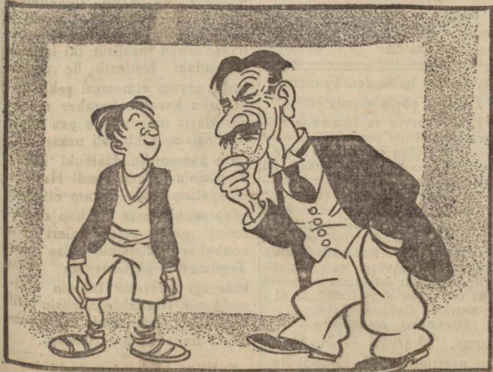
—Baba, ben Bebekten,Anadoluhisarına yüzerek geçiyorum. — —Öğüm asıl marifet, imtihan verip sınıftan geçmektileri.