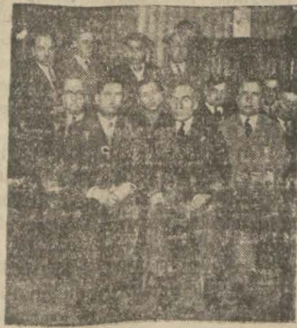
İstanbul fabrikatörleri dünki içtimalarında

Dahili sanayiden alınan muamele vergisinin kaldırılmıyacağı hakkındaki haberler üzerine İstanbul fabrikatörleri dün sanayi birliğinde hararetle bir içtima yapmışlardır.