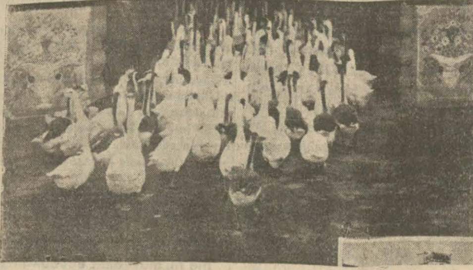
Kişmir sokaklarında mukaddes kazlar

Hususi havuzlarda yıkıyorlar, hizmetçileri var, eğlencelere gidiyorlar