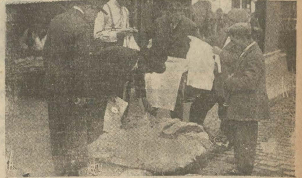
İşportacılar toptancı esnafın tezgâhtarlarıdır