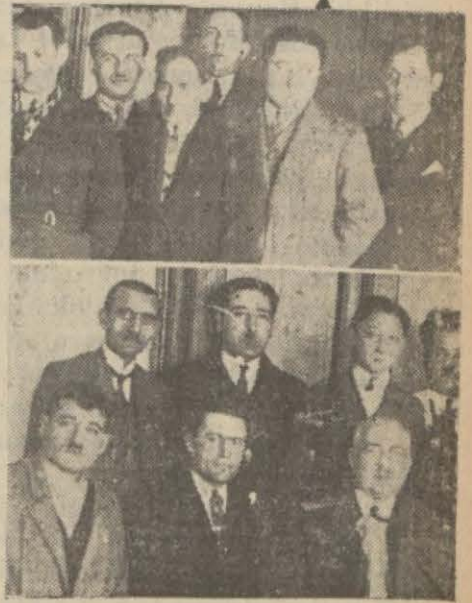
Dünkü intihapta bulunanlardan bir kısım

Berberler cemiyeti idare heyeti intihabına dünden itibaren başlanmıştır.