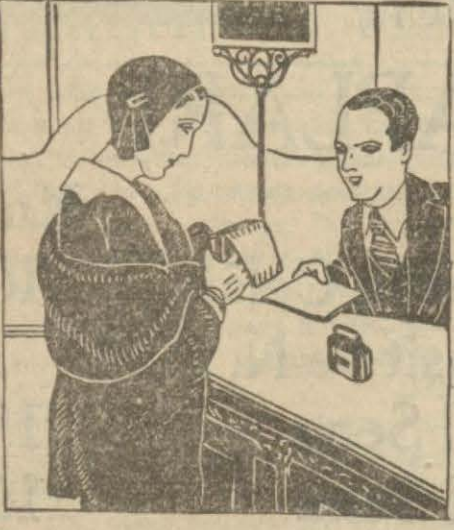
Ziraat Bankasında Kendinize Bir Hesap Açtırınız.

Hiç tereddüt etmeyiniz, hemen Ziraat Bankasına gidiniz, oradan bir kumbara alınız!