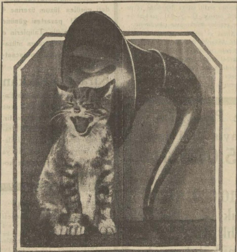
Kedi ve Radyo