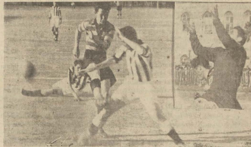
Sırp takımile yapılan maçlardan

Beşiktaş : 1 — Beogradski : 1 Galatasaray : 3 — Beogradski : 2 Fenerbahçe : 1 — Beogradski : 1