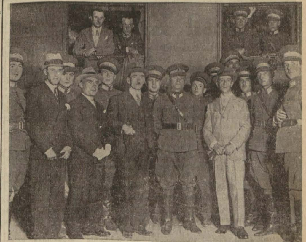
Binicilerimiz, Sirkeci İstasyonunda teşyie gelen arkadaşlarıyla birlikte

[Yazısı 4 üncü sayıfamızda spor sütunumuzda]