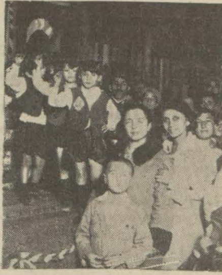
Millet mekteplerinin küşad münasebeti dersanelerden birinde dün akşam verilen müsamere