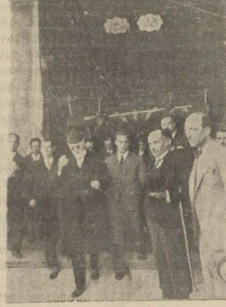
M. Venizelos Ayasofya camii'nden çıkarken

Yunan Başvekili ile Hariciye vekilinin Vakıf muharririne söyledikleri